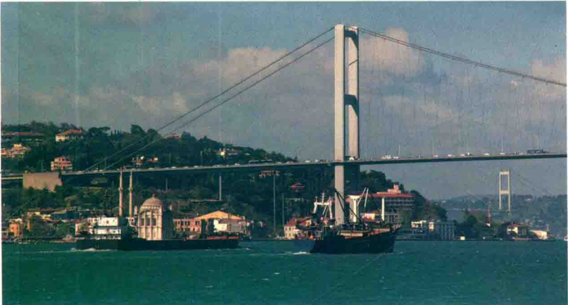
▲伊斯坦布尔海峡（博斯普鲁斯海峡）大桥

蓝眼睛 模仿的是邪惡之神的眼睛，是一种蓝色眼状护身符。土耳其人特别喜欢“蓝眼睛”，相信它能“辟邪”。它不仅出现在婚礼、葬礼等重大仪式上，日常生活中，人们也会把“蓝眼睛”放在胸前的口袋里，或是别在书包上，从而祈求神灵的庇护。