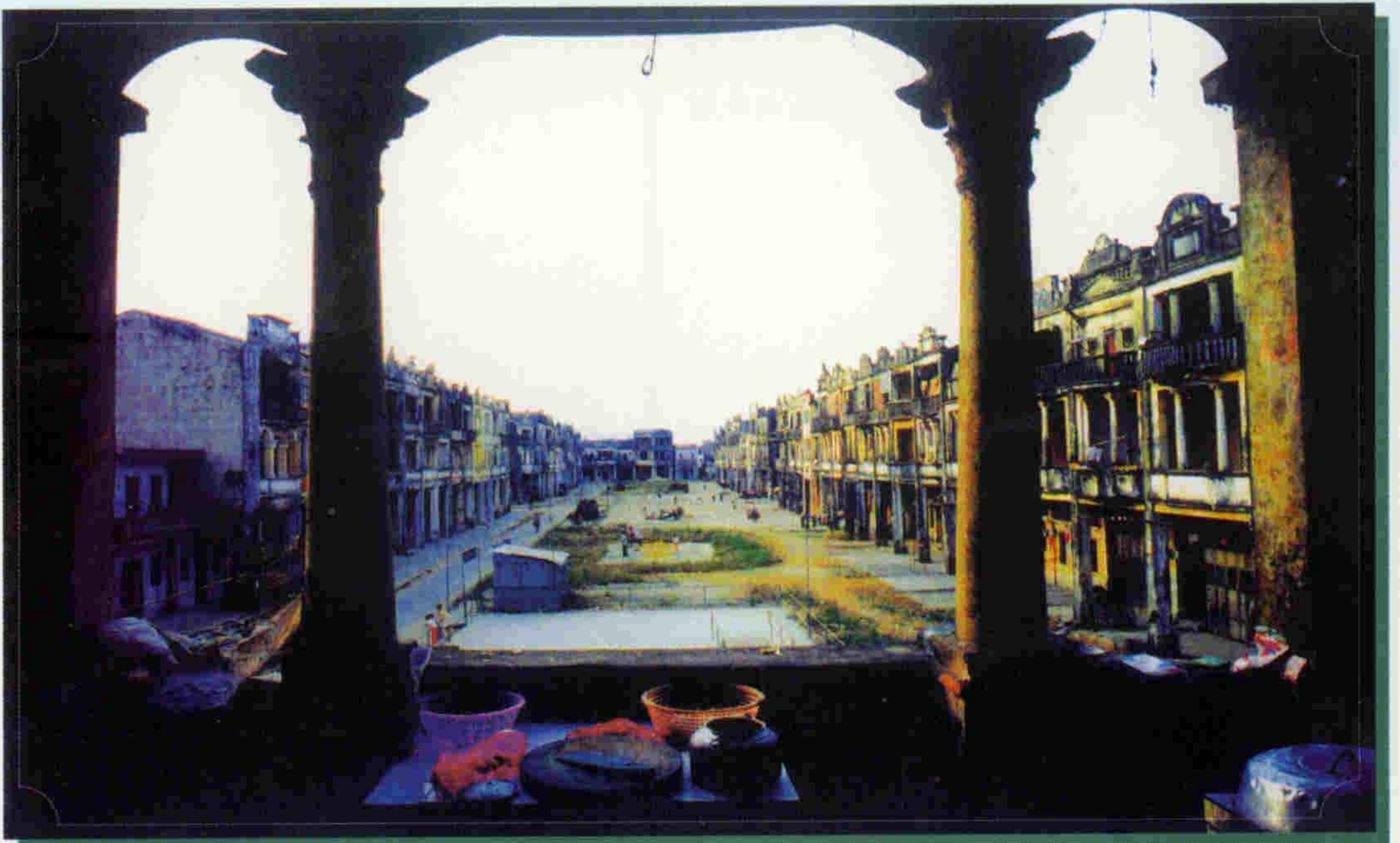
台山端芬汀江梅家大院骑楼建筑群