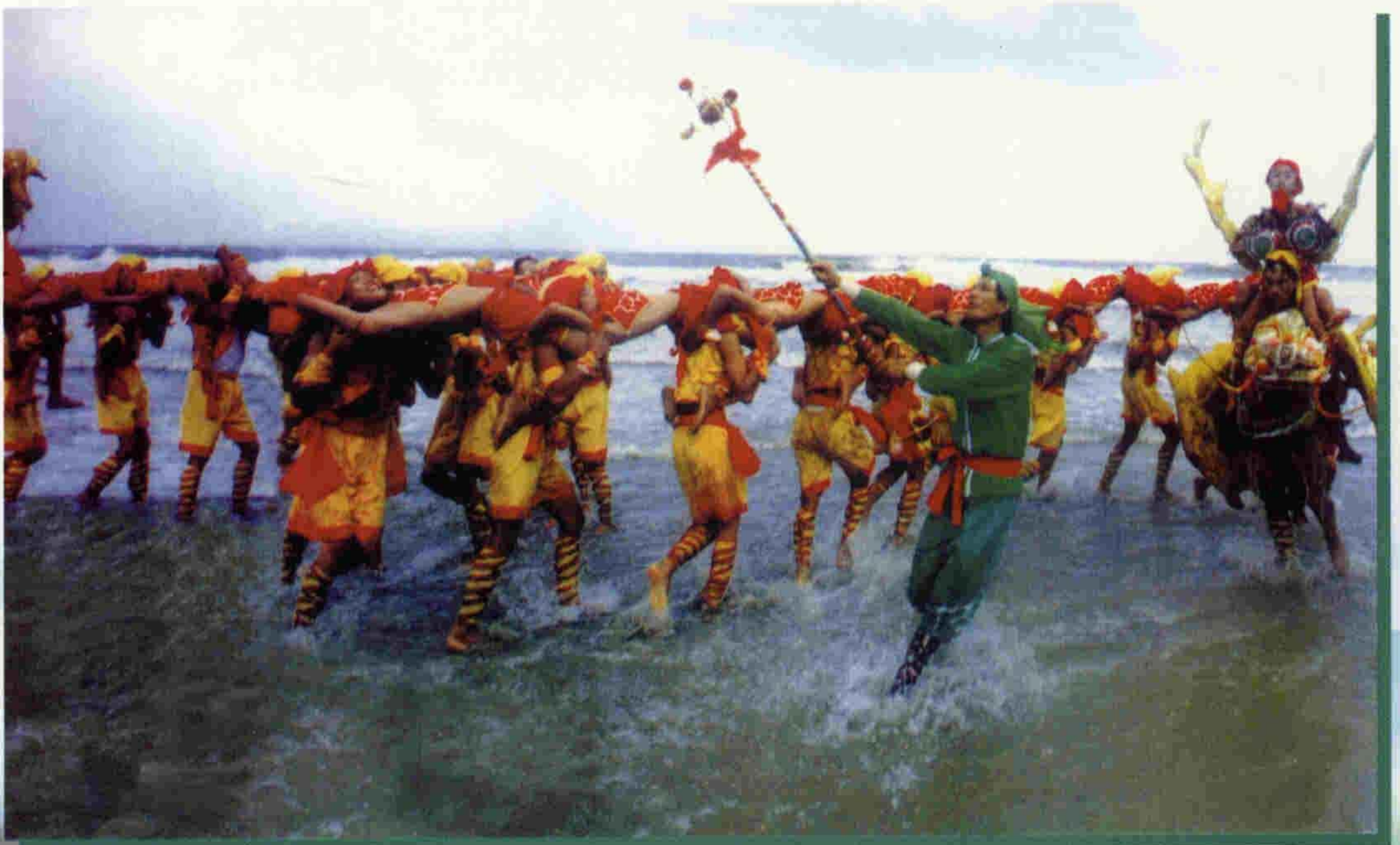
湛江东海岛人龙之舞