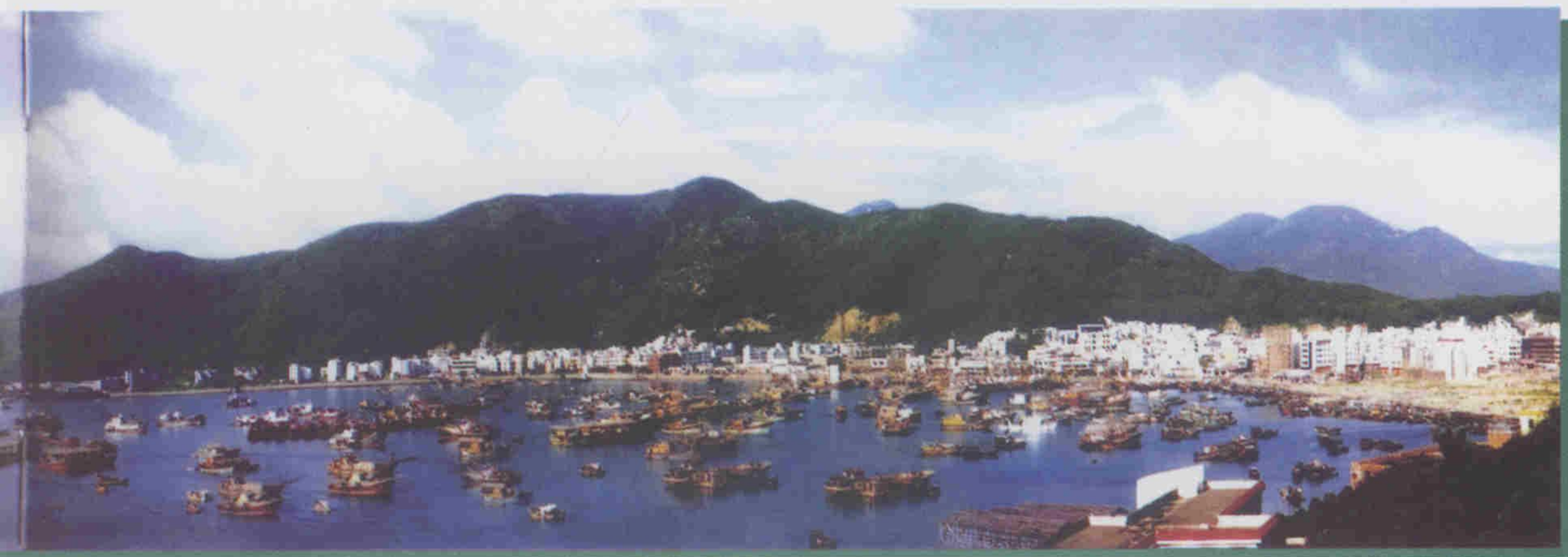
阳江渔港