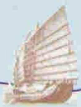
古越人对龙蛇图腾崇拜 演变为今日珠江口赛龙舟