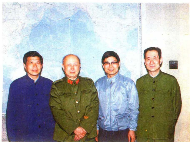
清华大学气功协作组与严新合作做了一系列科学实验，取得重要成果。1987年4月18日，钱学森同志和张震寰同志接见了协作组的同志，听取了工作汇报。