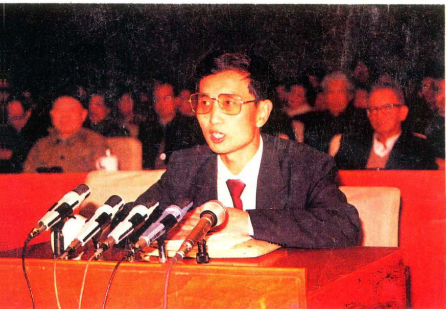
1987年11月7日晚，严新在中央党校作报告