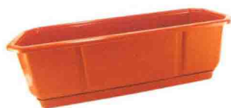
直径为 15~20 厘米的容器

小型的容器一般指的是直径为 15~20 厘米的容器，比较适合种植猫薄荷、百里香、细香葱、驱蚊草等植株体积很小的香草。