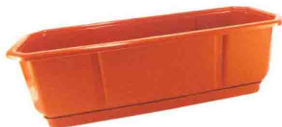
直径为 20~30 厘米的容器

中型容器一般指的是直径为 20~30 厘米的容器，长方形的中型容器长一般是 65 厘米左右。这种容器适合种植体型一般的花卉、香草，也可以种植菠菜、油菜等叶类蔬菜。