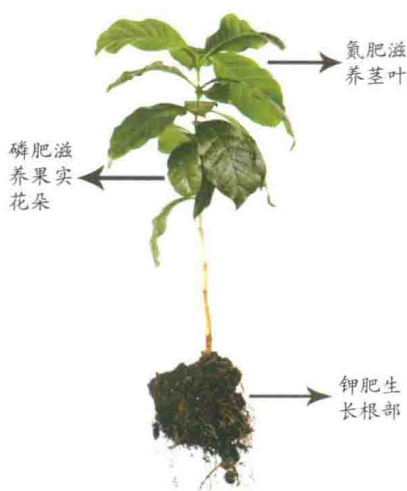
各种肥料对植物的不同作用

按照肥料的成分来划分，可以分为磷肥、氮肥、钾肥这三种肥料。磷肥主要是用来促进植物花朵和果实的生长，氮肥主要是用来促进植物叶子的生长，钾肥可以有效地滋养植物的根部。