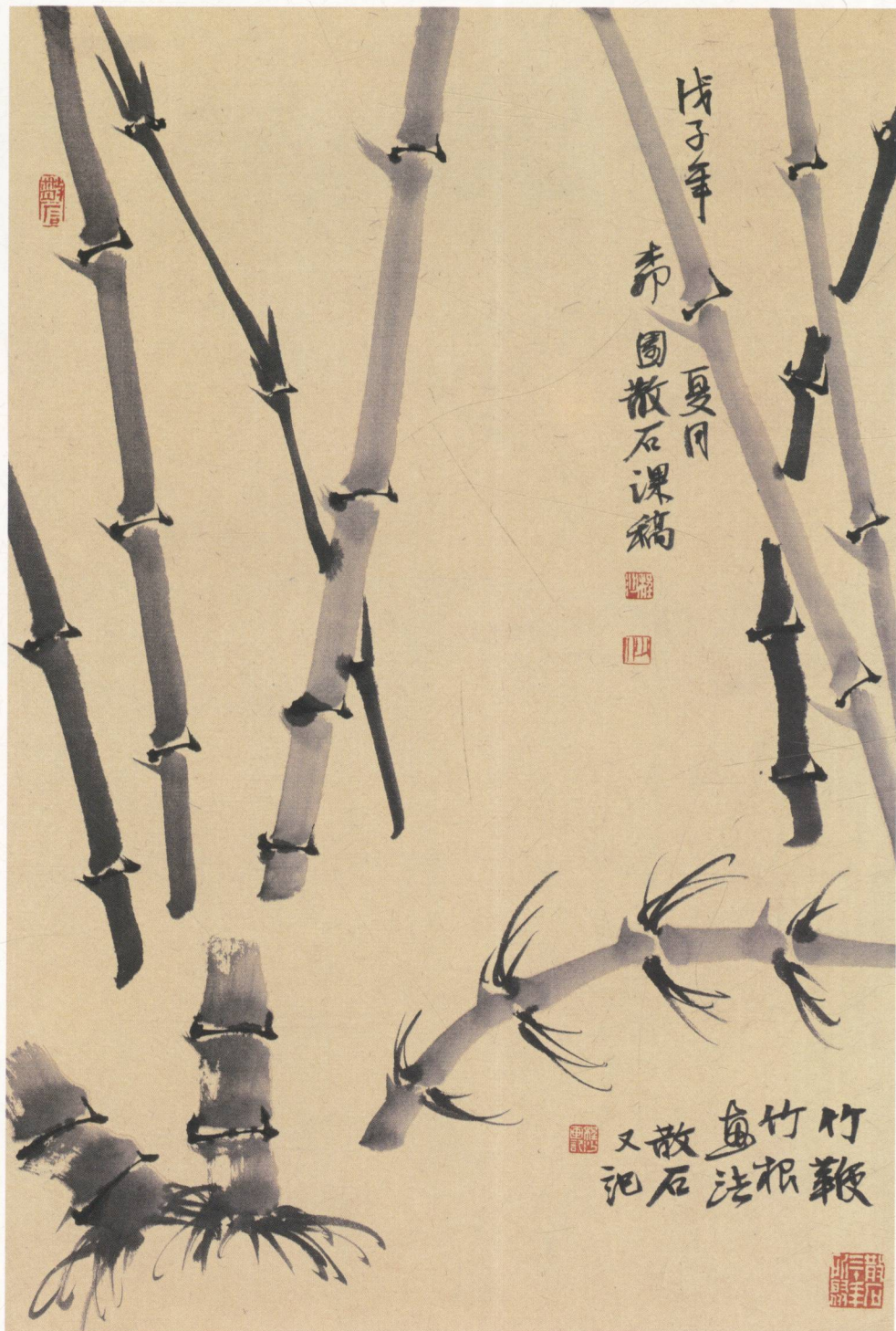
竹鞭、竹根的画法图解