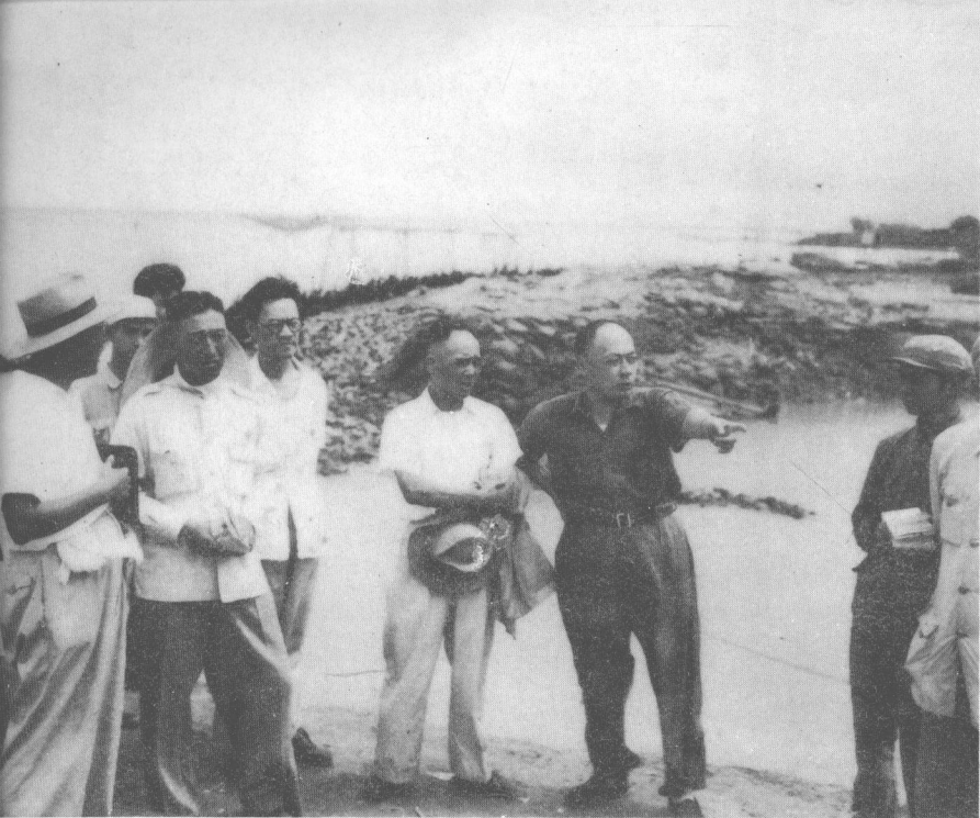
陈毅和赵祖康副市长一起视察海堤。