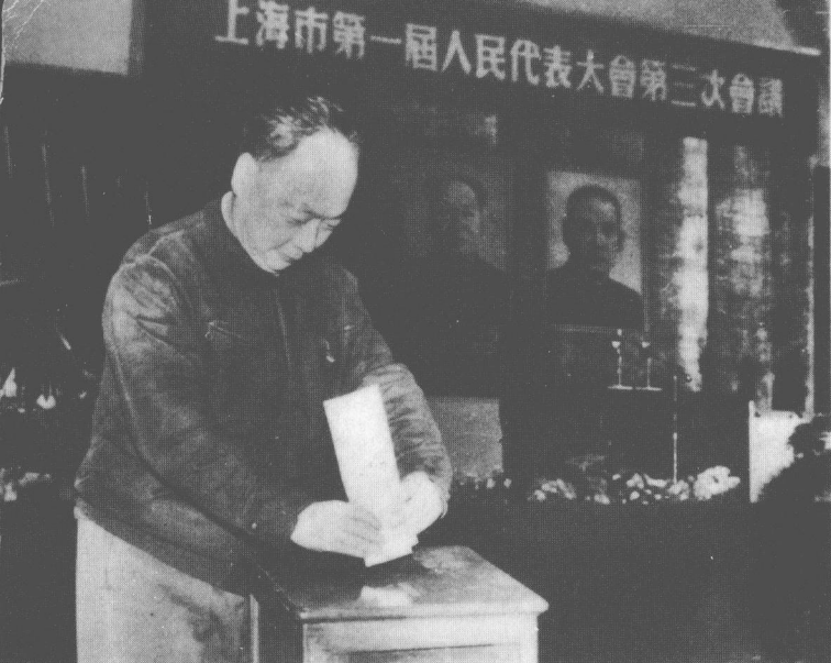
在上海市 一屆三次人代 大會上投票。