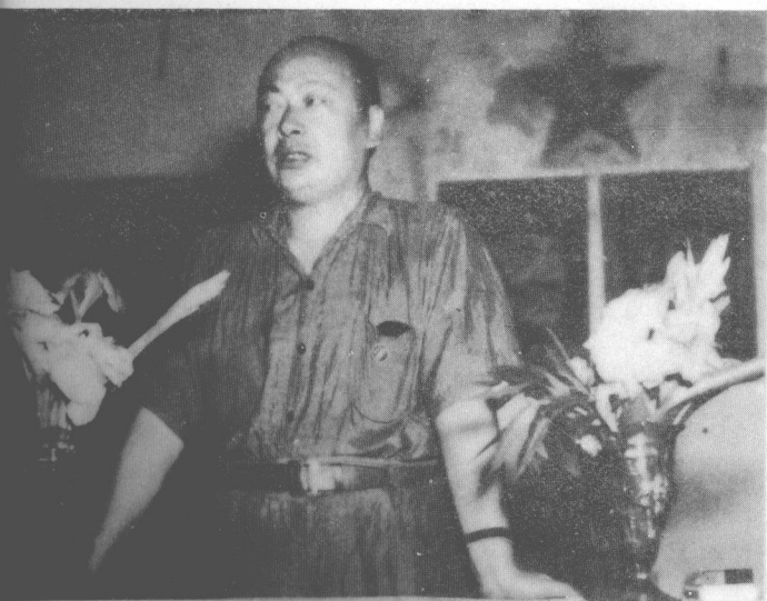
陈毅在群众大会上讲话。