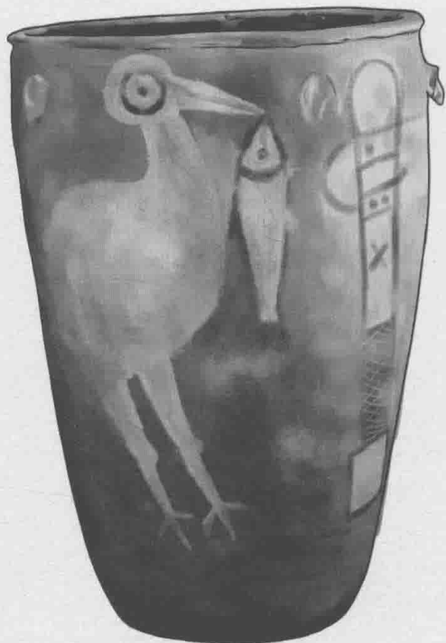
◎ 鹤鸟叼鱼缸 仰韶文化 庙底沟类型

这是盛放尸骨的葬具。图案颇有意味，鱼是仰韶文化半坡类型的图腾或族徽，而鸟是庙底沟类型及其东方变体阎村类型的图腾。把鸟画得雄壮有力，鱼则顺身就擒，暗示着其部族极力张扬，鸟强鱼弱的主题。