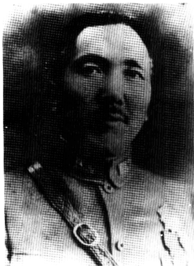
在忻口抗日战场上阵亡殉国的 中国陆军第九军军长郝梦龄将军