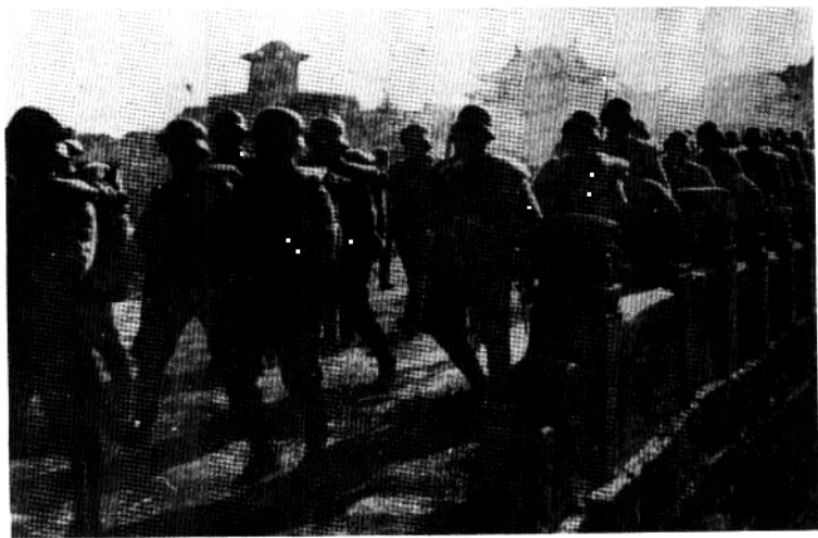
忻口会战时期中国抗日军队开上前线