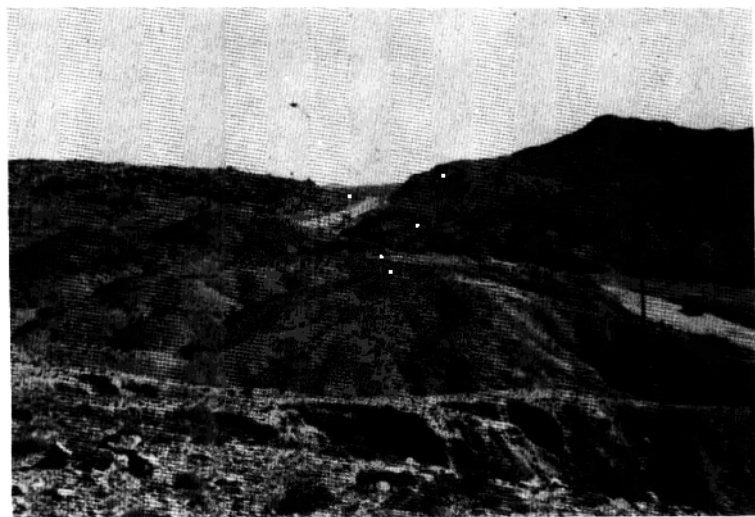
绥西抗战乌不浪口战场