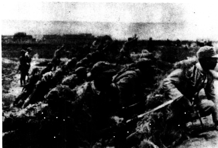
中条山中国抗日军队待命出击作战