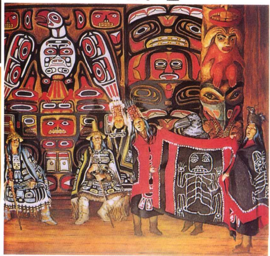
69.中华开天辟地鼠姓天乙始祖伊萨姆那;70.奥尔梅克雷泽雷祖大头雕像(17尊);71.玛雅手持壶天 \pi 矩尺的盘古氏太皇;72.伊萨姆那弁兹氏传人风神雨神伏羲勾芒,肩上有凤、且二字;73.南美洲摩且风姓太阳神;74.北美洲因纽特(夸父族)雷鸟,酋长戴昆侖通天柱冠