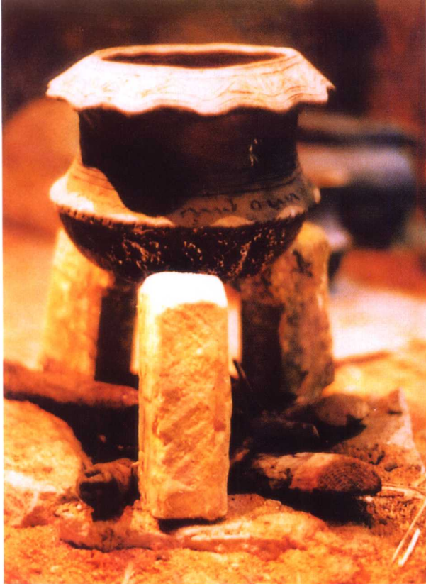
21. 9000年前湖南彭头山文化传彘兹鸟支座；22. 7000年前浙江河姆渡文化三青鸟彘兹支座；23~27. 7400年前河北磁山文化风姓(23.26)彘兹氏鸛鸟(鸛、雉)支座(24.25)与柱州昆侖器(23.26)