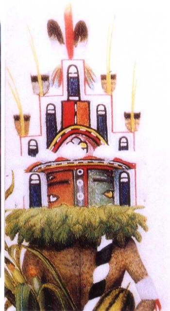
15.7000年前江苏青莲岗文化风姓志(文字); 16.藏族传风姓“巴郭”头饰; 17.藏族传博山天齐法冠; 18.苗族传博山天齐柱昆侖冠; 19.印尼岂厘島传博山天齐雷神傩面; 20.北美洲赫比族传昆侖天齐盖天杆