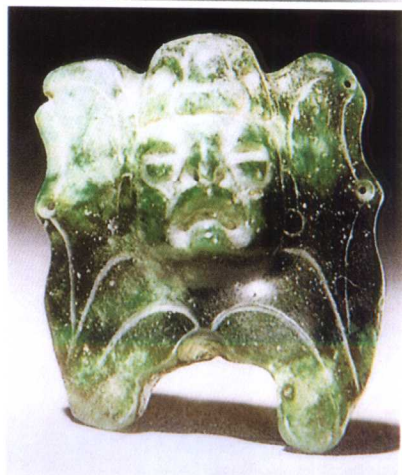
55. 刻有燧人氏𠃉𠃉文字和画像的帝王座, 奥尔梅克文化; 56. 夙姓雷祖夙兹氏坐像; 57. 赫比族夙兹氏贝雕, 颈戴燧人氏𠃉标志颈链; 58. 夙姓太昊玉雕像; 59. 夙姓赫胥氏步天穹琬圭; 60. 少昊(兄)鸞红陶绿袖璇玕; 61. 太昊氏合玄(几)玉雕像·奥尔梅克文化(55.56.58-61.)