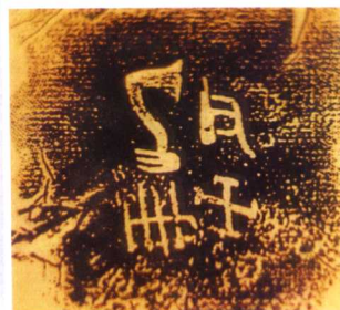
35. 四川广汉三星堆文化传挺木牙璋牙器；36. 玛雅文化传鸟型牙璋挺木牙交； 37. 5500年前河南陕县庙底沟文化传夔兹氏徽铭弁鸟(洛鸟)；38. 玛雅文化传燧人氏 玄女挺木牙交Y；39. 4000~1100年前内蒙古老哈河(土河)夏家店文化共工后土氏传 凤姓标志；40. 赫胥氏族徽；41. 42. 夏家店文化传夔兹氏三青鸟玄融(康回)风姓标 志；43. 河姆渡文化三青鸟鸟喙陶器