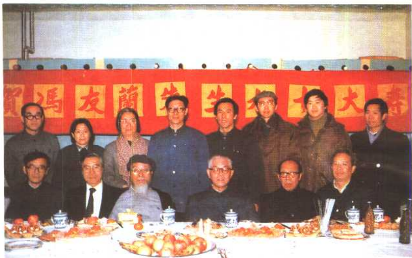
1985年在庆祝冯友兰先生九十寿辰大会上， 前排左起黄楠森、冯鍾辽、冯友兰、张岱年、朱伯崑、汤一介。