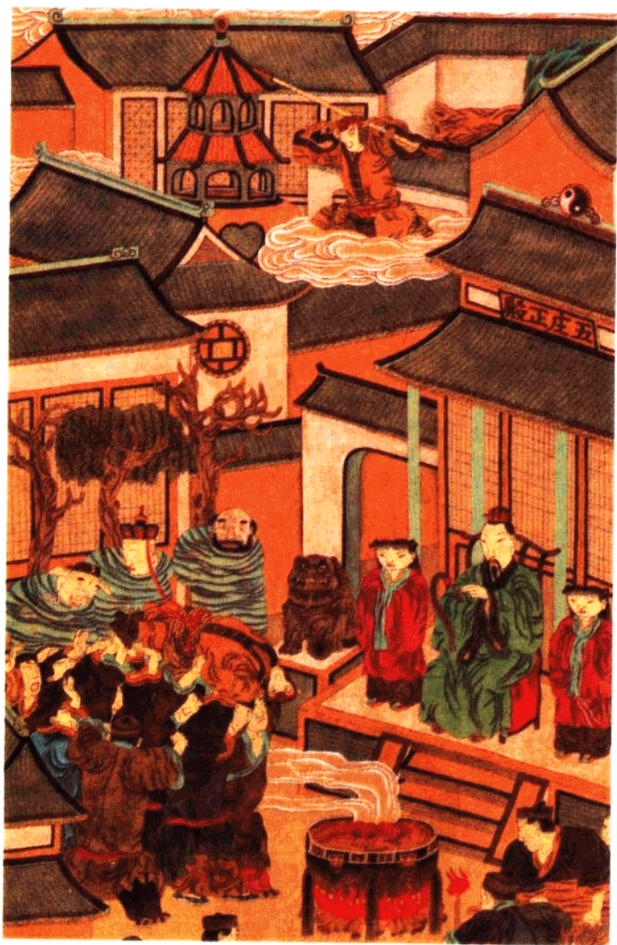
孙行者大闹五庄观