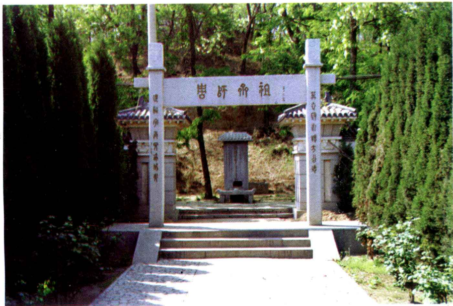
姜太公衣冠冢前坊