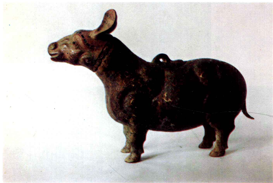
金银错镶嵌铜牺尊（战国）