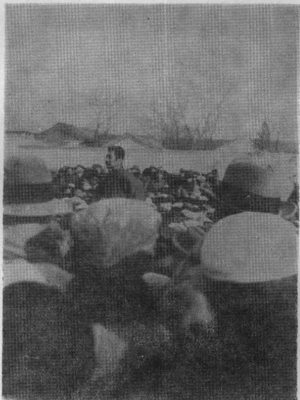
1932年11月27日摄于北京师范大学操场