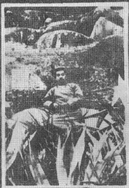
1927年1月2日摄于厦门南普陀