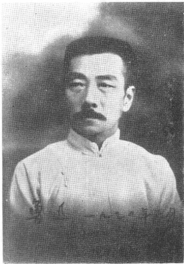
魯 迅 像