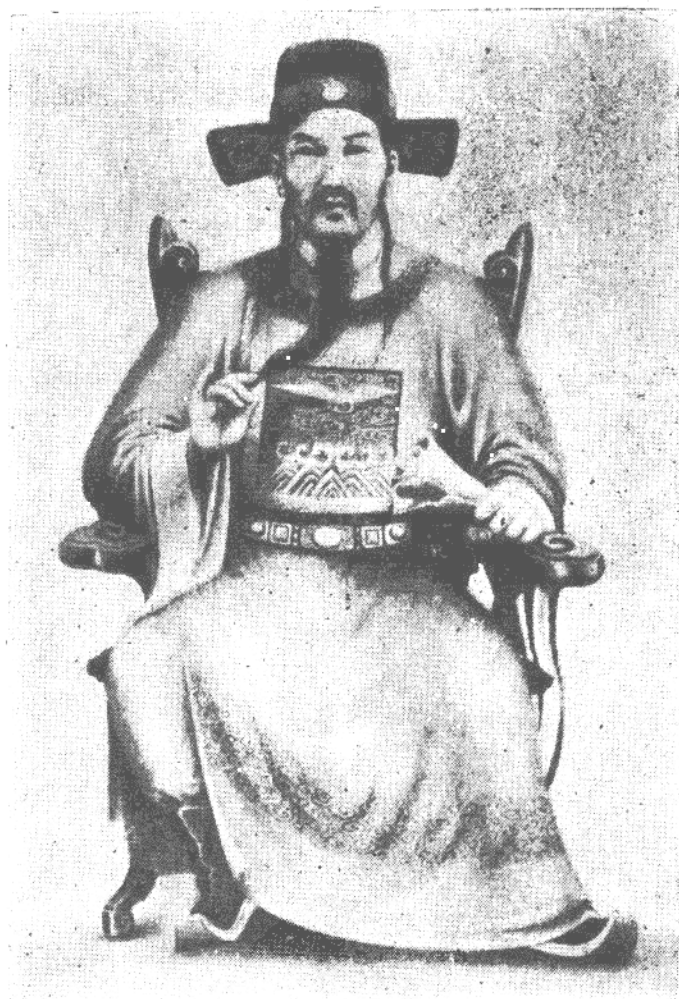
迁琼始祖仁德公像