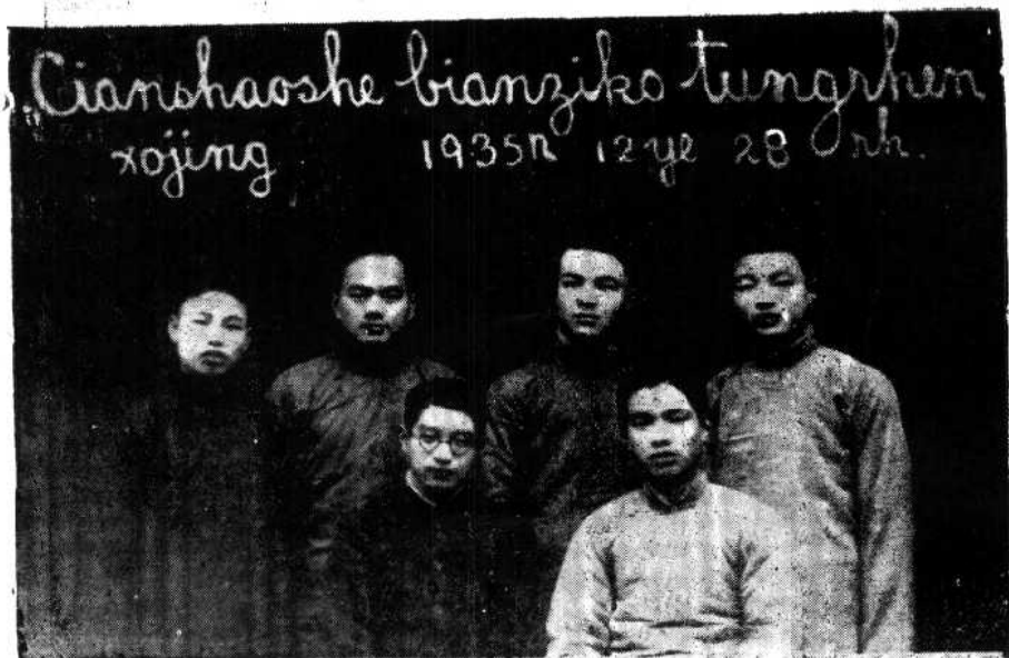
“前哨社”编辑课同仁合影