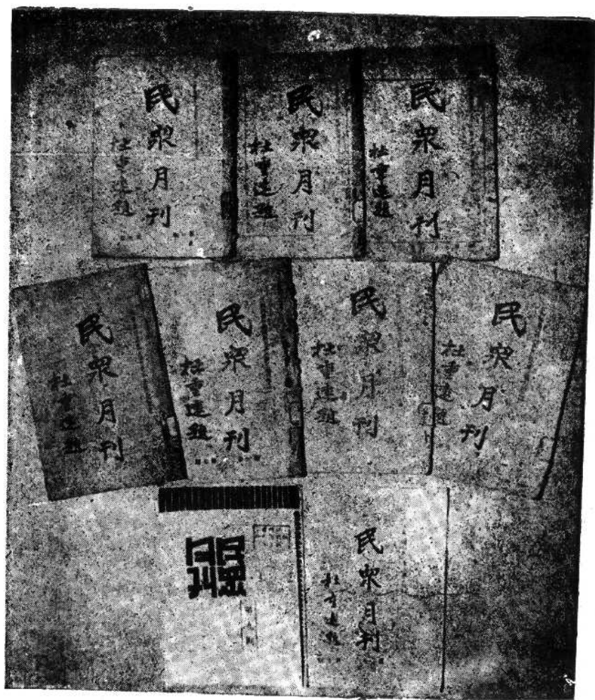
江西陶业管理局露天讲演场的定期刊物《民众月刊》1—9期