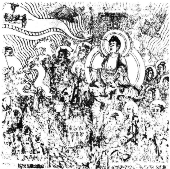
宋代《妙法莲华经》引首