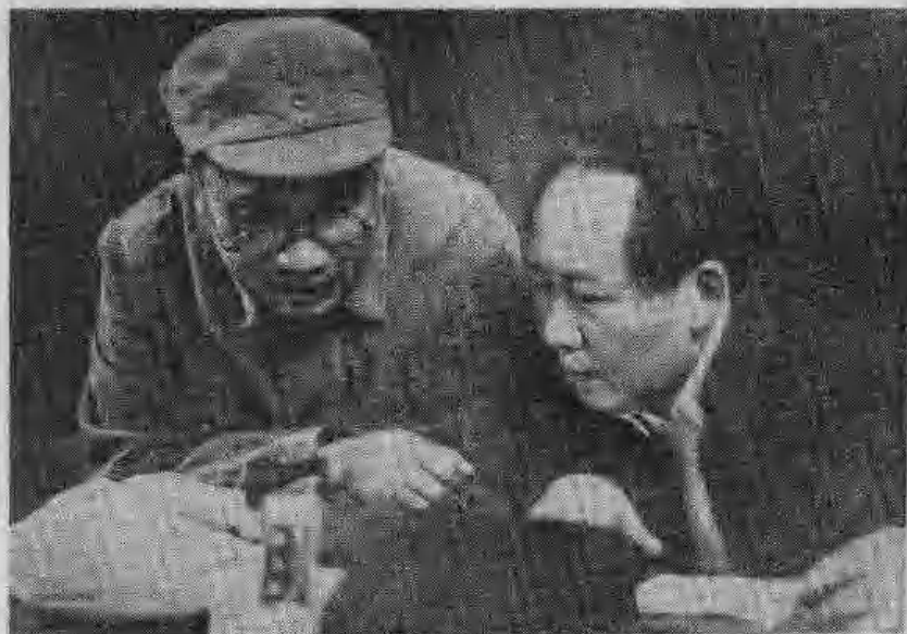
抗日戰爭時期的毛澤東同志和朱德同志