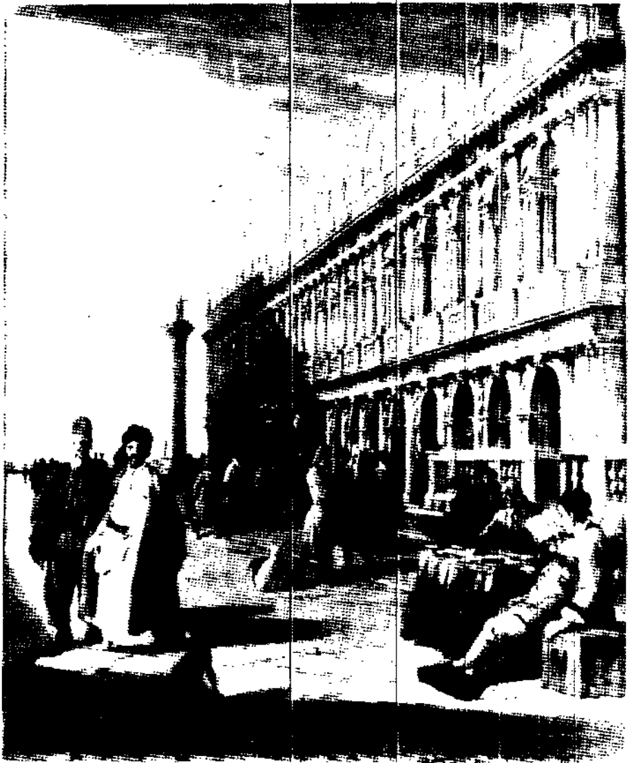
威尼斯原是十五世纪欧洲经济世界的中心，到十七世纪末和十八世纪初，它仍是东方人宾至如归的国际城市。卢卡·卡勒瓦里作画：《广场》（细部）