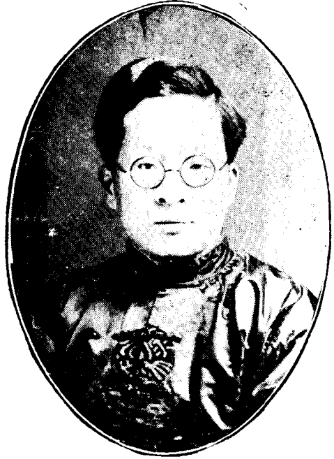
影近如晏孫者訂參