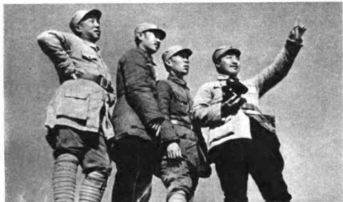
一九三七年十月十八日，贺龙同志和关向应等同志在雁门关前线视察。