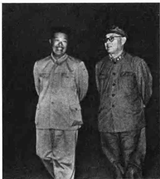
一九六四年 九月，叶剑英同 志和贺龙同志在 北京南苑。