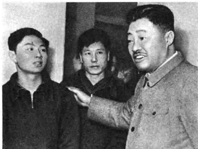
一九六五年一月二十日，贺龙同志在国家乒乓球队表扬运动员徐寅生同志学习毛主席著作的优异成绩。