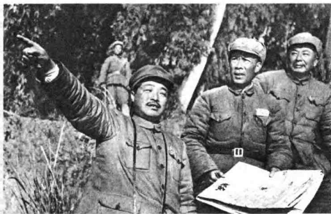
一九四九年，贺龙同志率领中国人民解放军第十八兵团向西南进军，和王维舟、周士第同志在进军途中。