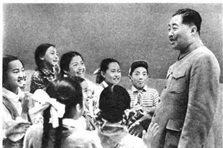
贺龙同志和少先队员在一起。