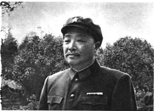
一九六六年四月，贺龙同志在成都住地。