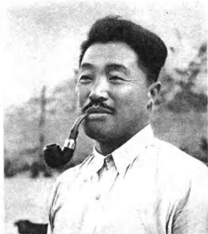
一九四四年，贺龙同志在延安。