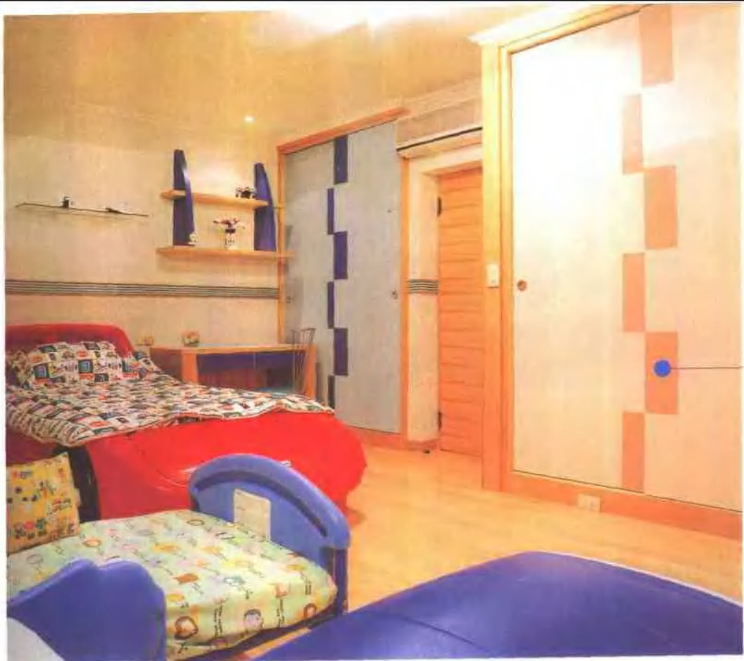
阶梯状的衣门柜吊架式的书柜 流露出不凡的美感