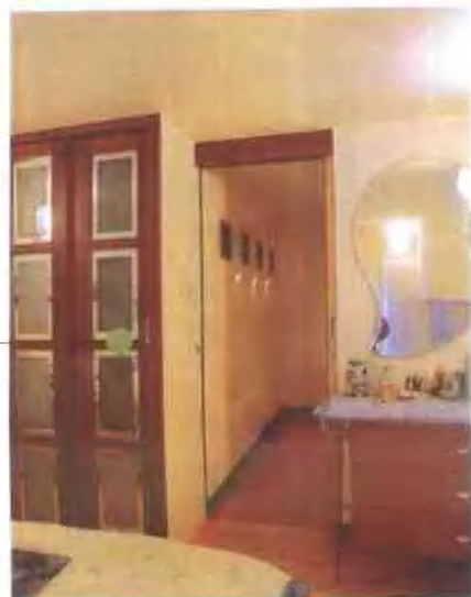
豆点形的镜子 精巧别致