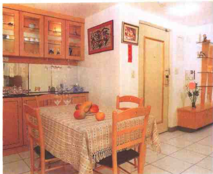
开放性的格局 保留了空间的完整性