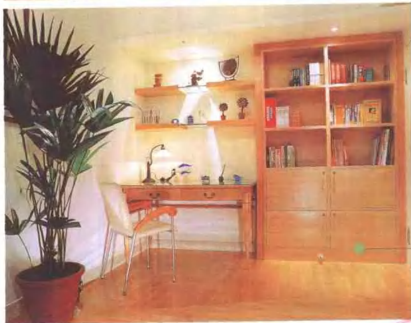
书房兼客房 井井有条美观实用