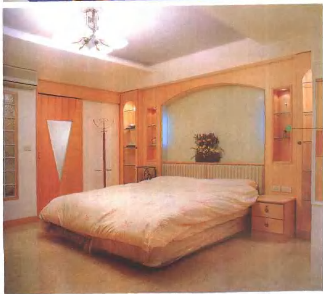
简洁的弓形架 左右伸展的柜架实用美观