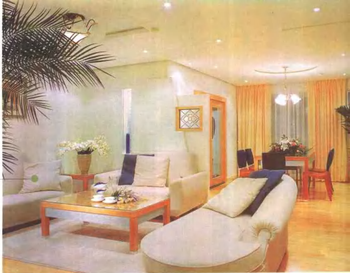
开放式的客厅餐厅 宽敞明亮