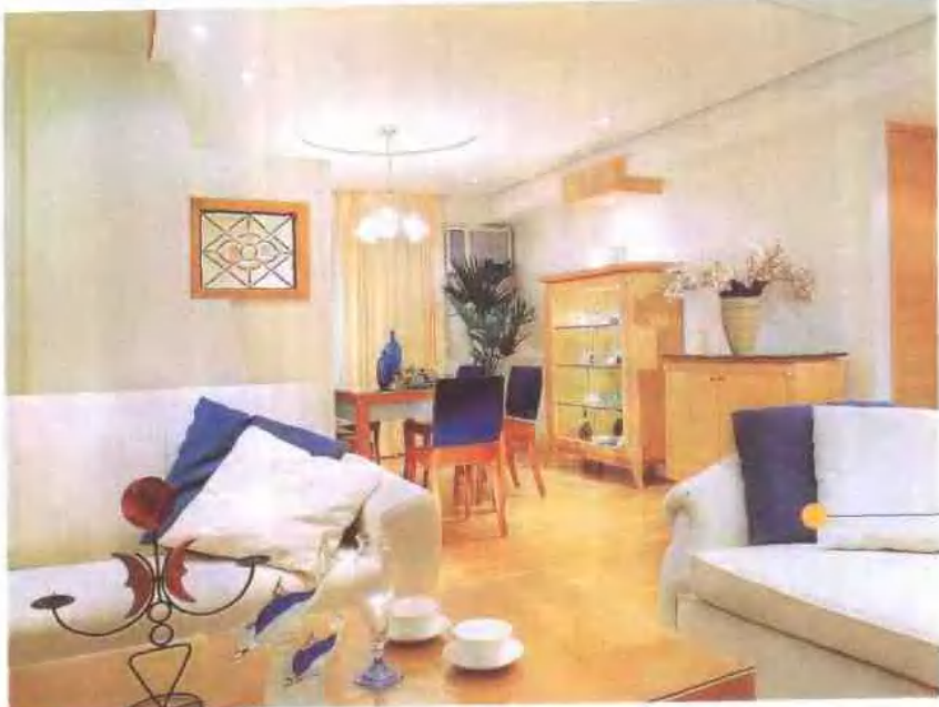
宝石蓝点缀了客厅 白色的主调