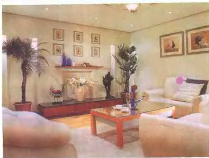
适度的绿色点缀 令客厅清新自然