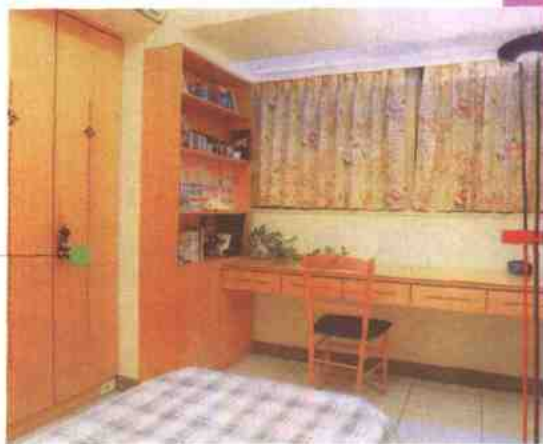
儿童房不凡的设计 保留成长的弹性