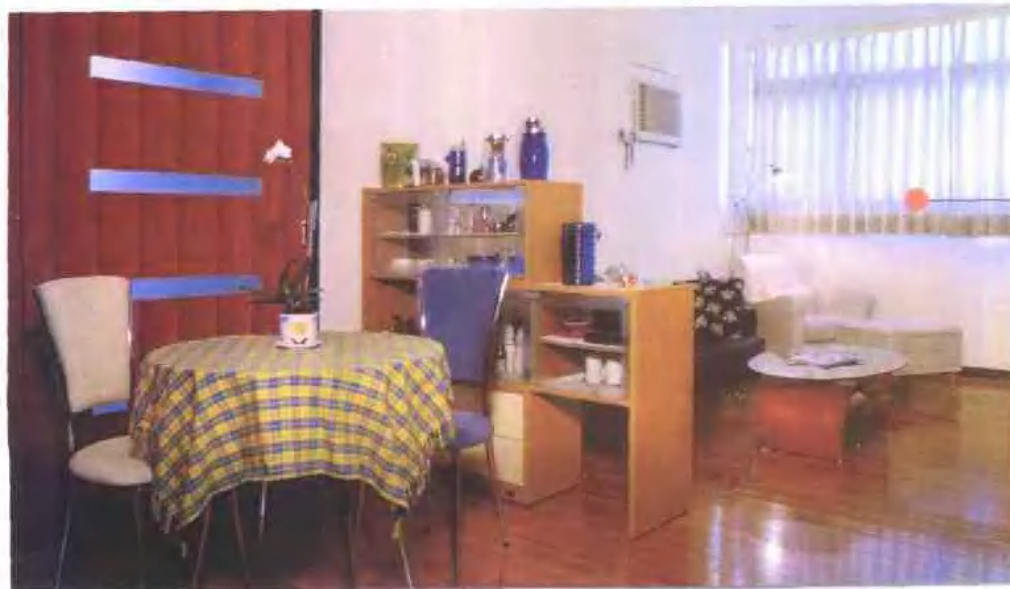
客厅家具的 巧妙设置 展现出宽敞的气韵