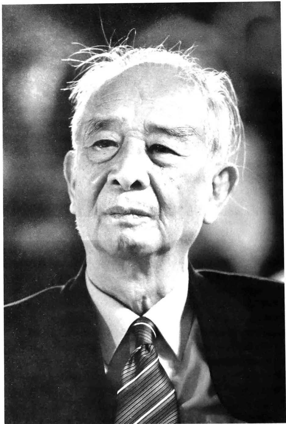
汤一介先生 (1927.2.16 ~ 2014.9.9)