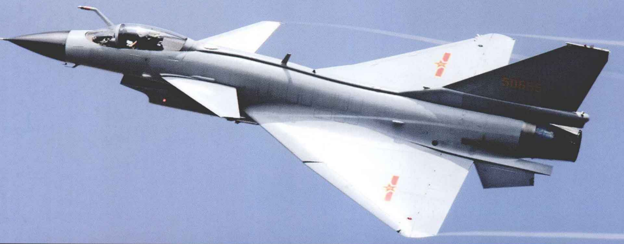
① 中国“飞豹”式战斗轰炸机 ② 中国歼-20 式隐形战斗机 ③ 中国歼-10 式战斗机