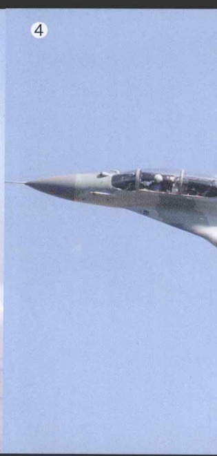
① 美国 F-14“雄猫”式战斗机 ② 英国“海鹞”式垂直起降战斗机 ③ 俄罗斯苏-34“鸭嘴兽”式战斗轰炸机 ④ 俄罗斯米格-29“支点”式战斗机 ⑤ 俄罗斯 T-50 式隐形战斗机