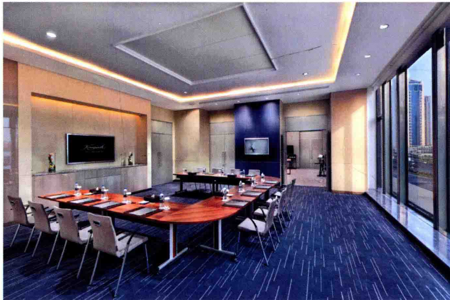
▲图1-6 半包围的环形会议桌让空间更加有序，使会议效果更佳。