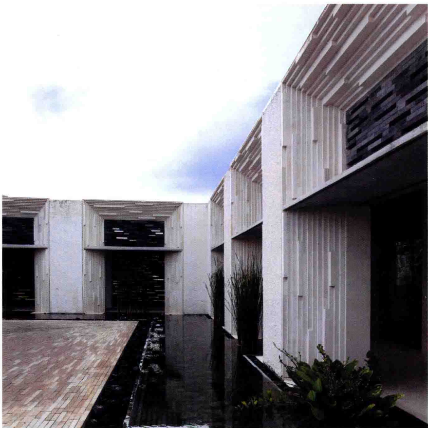
▲ 图1-1 墙面以乳白色和灰色相结合，反复运用线条的交错，凹凸有致，构成一个放射面，加上绿色植物的陪衬和镶嵌式地面的结合，让整个干净利落的现代空间不失活跃。

20世纪20年代，随着新兴工业崛起，建筑材料、设备、施工工艺的不断提高，钢筋混凝土的广泛运用，促进了美国酒店业的快速发展。这一时期具有代表性的酒店有1908年在美国落成的第一家商务酒店——斯泰特勒酒店。20世纪50年代后，随着新结构、新技术、新型材料的运用，酒店业飞速发展，在西方文化艺术的影响下，酒店设计从单纯的满足物质功能走向创造精神功能的阶段。现代的酒店不光能为客人提供舒适、便利、清洁的服务，同时，客人也要求酒店提供更为个性化的服务，酒店的市场定位更为专业化。（图1-1，图1-2）