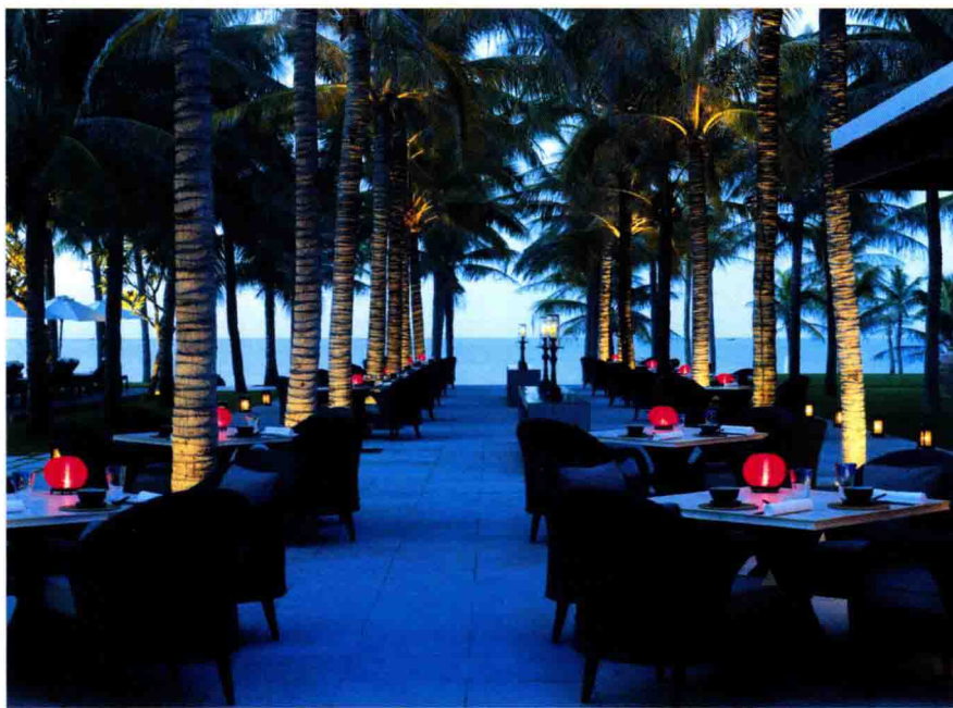
▲ 图1-4 成片椰树下错落有致的餐桌上点上灯火,极具浪漫气息的海滨度假环境。