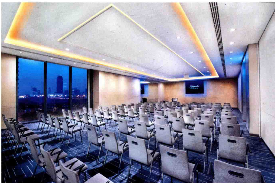
▲图1-5 深灰色的地毯配上浅色的座椅，使会议空间显得简洁、大方。

（5）精品酒店，酒店业格局出现大规模分化开始于20世纪90年代喜达屋（Starwood）旗下的精品酒店品牌W酒店（W Hotels）的成功运营，巨大的市场回报拉动了精品酒店的蓬勃发展。目前，精品酒店还有些名称如艺术酒店、时