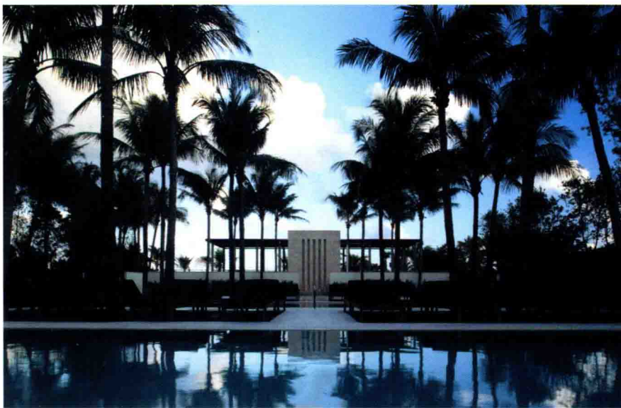
▲ 图1-3 蓝天白云下的热带植物,使人身心愉悦。

(2) 会议型酒店,主要是指能够独立举办会议的酒店,它是以接待会议旅客为主的酒店。举办国际会议的酒店一般位于交通便利的城市中心。一项国际会议的举办将大大提高城市或地区的知名度。除具有一般酒店的食宿娱乐外,会议型酒店还应妥善设置会议接待机构、有完善的会议服务设施,如大小会议室、同声传译设备、投影仪