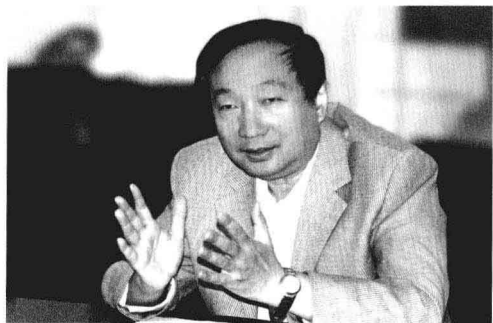
▲中国图书馆学会阅读推广委员会主任，深圳图书馆馆长吴晞