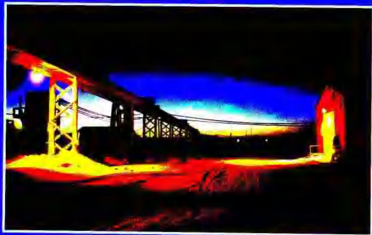
2. 极夜里的北冰洋考察站