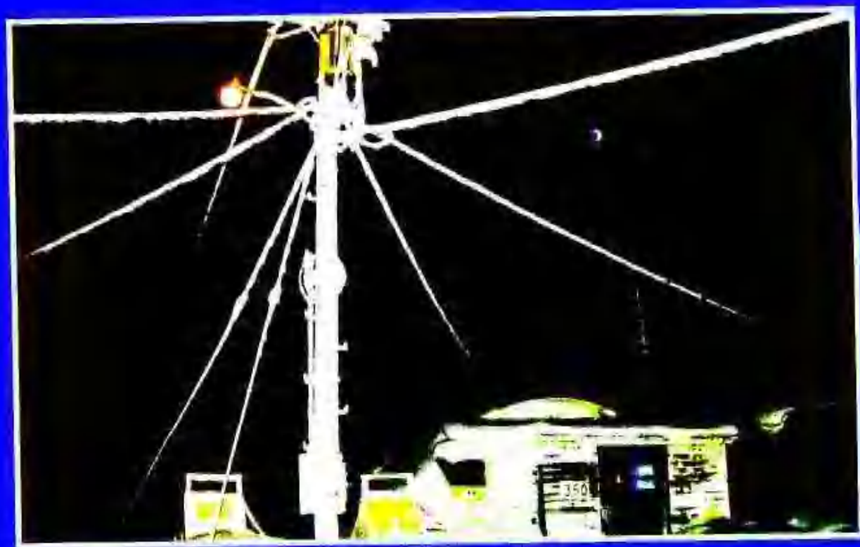
4. 极夜里的北极实验室