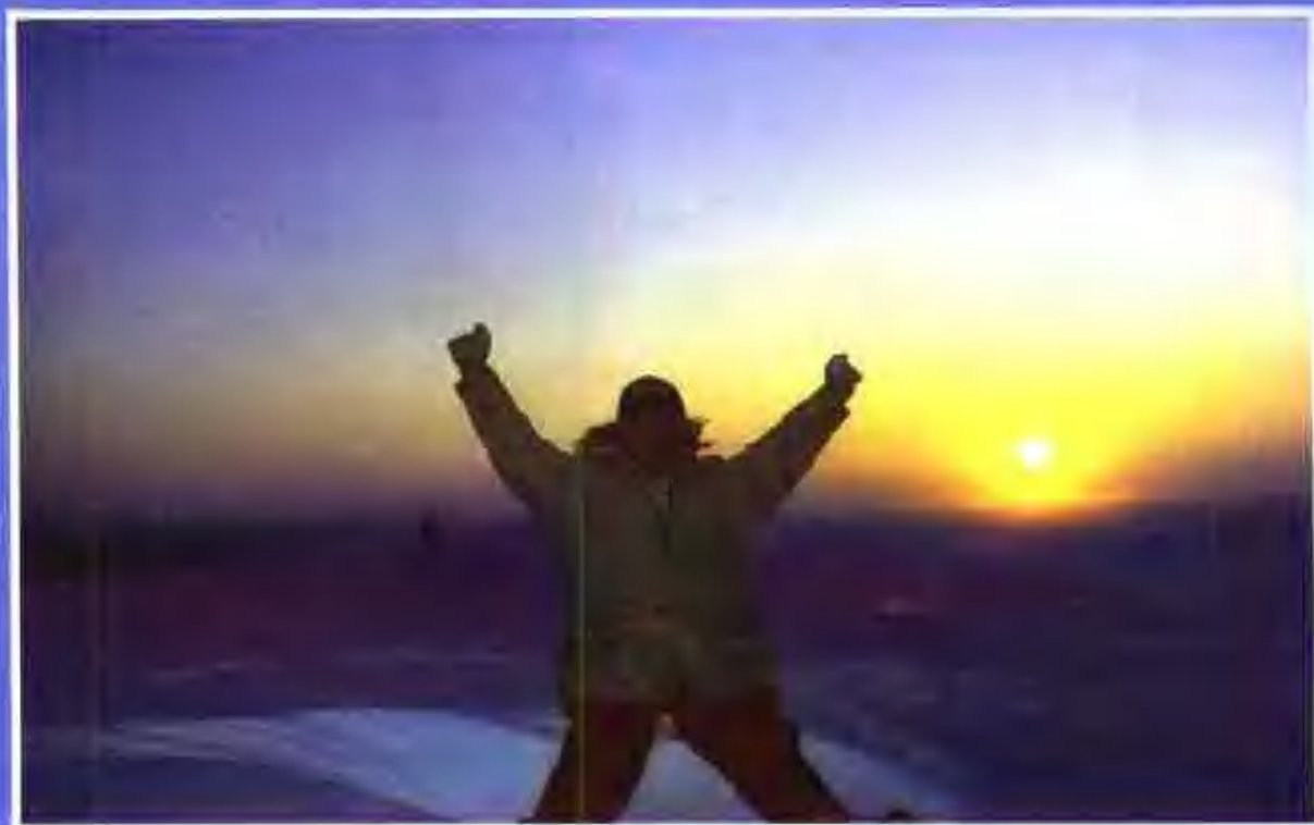
12. 为极夜后的太阳而欢呼