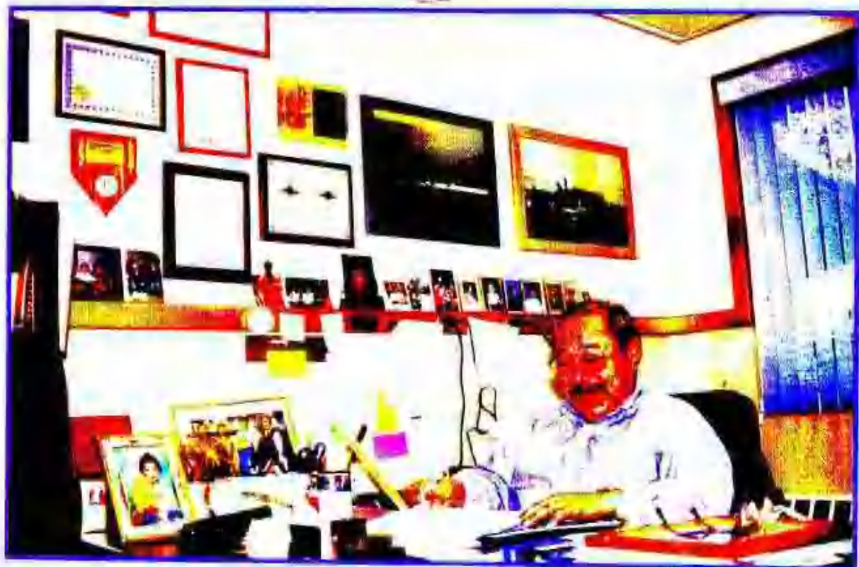
5. 查理叔叔在他的办公室里