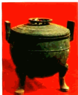
▲ 罍 （浙川 下寺一 号墓出 土）