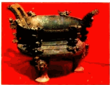
▲王子午尊（浙川下寺二号墓出土）