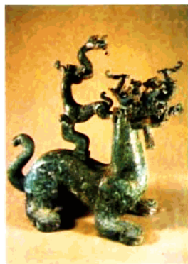
◀ 铜铸松 石制底座 一器四座 家珍九号 景出上