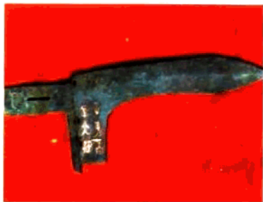
▲王孙诒剑（浙川下寺二号墓出土）