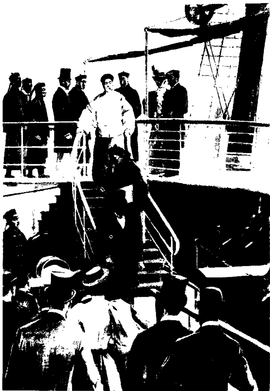
一八九六年八月二十八日圣路易号轮船抵达纽约，李鸿章正下舷梯，受到美国官员及各界人士的欢迎。