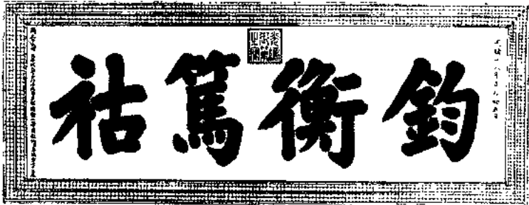
EMPEROR'S INSCRIPTION ACCOMPANYING THE GIFTS SENT TO THE VICTORY BY HIS SEVENTIETH BIRTHDAY