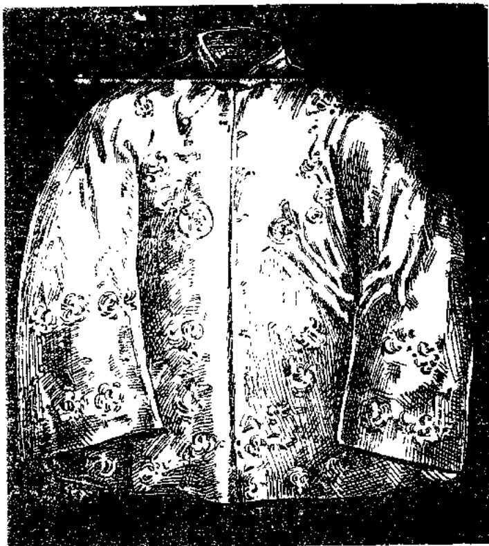
御賜与李鴻章的黃馬褂