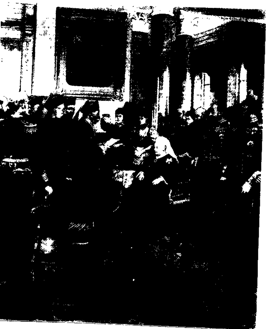
一九六六年十一月，昆士維特公爵阿諾爾伯爵與英國維多利亞女王在遊園