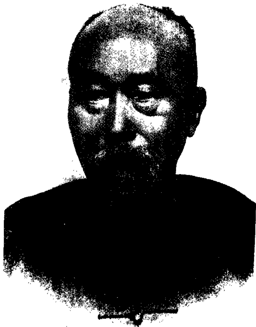
李鴻章像 一八九六年攝影，左眼下為一八九五年在日本 馬关被刺留下的槍彈傷痕。