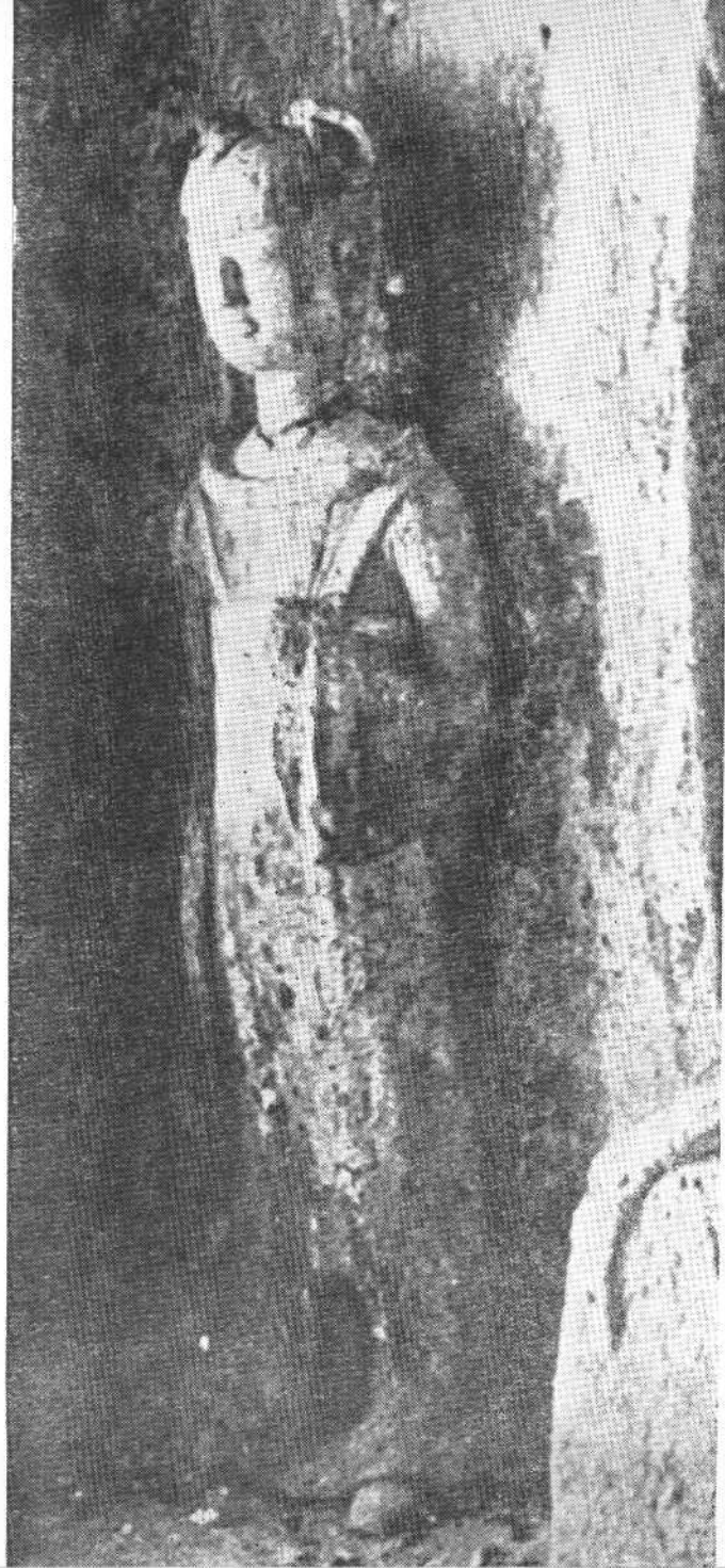
供養童女（麦积山第一二三号窟石壁右侧魏代塑像）