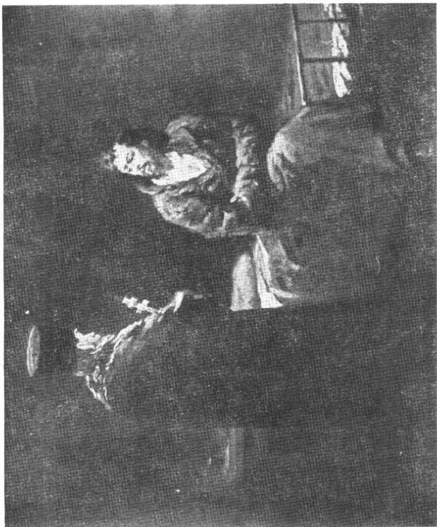
拒绝临刑前的忏悔