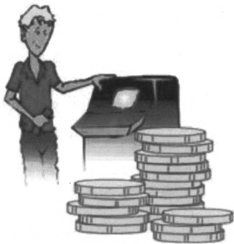
中国的“月光族”青年令人担忧