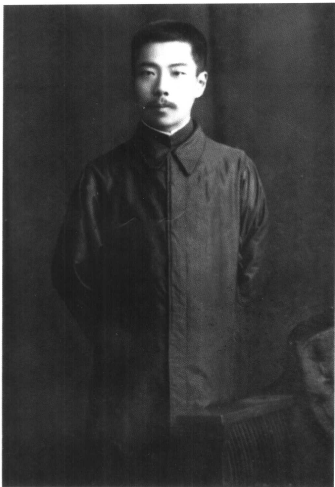
辛亥革命后摄于绍兴（一九一二年）