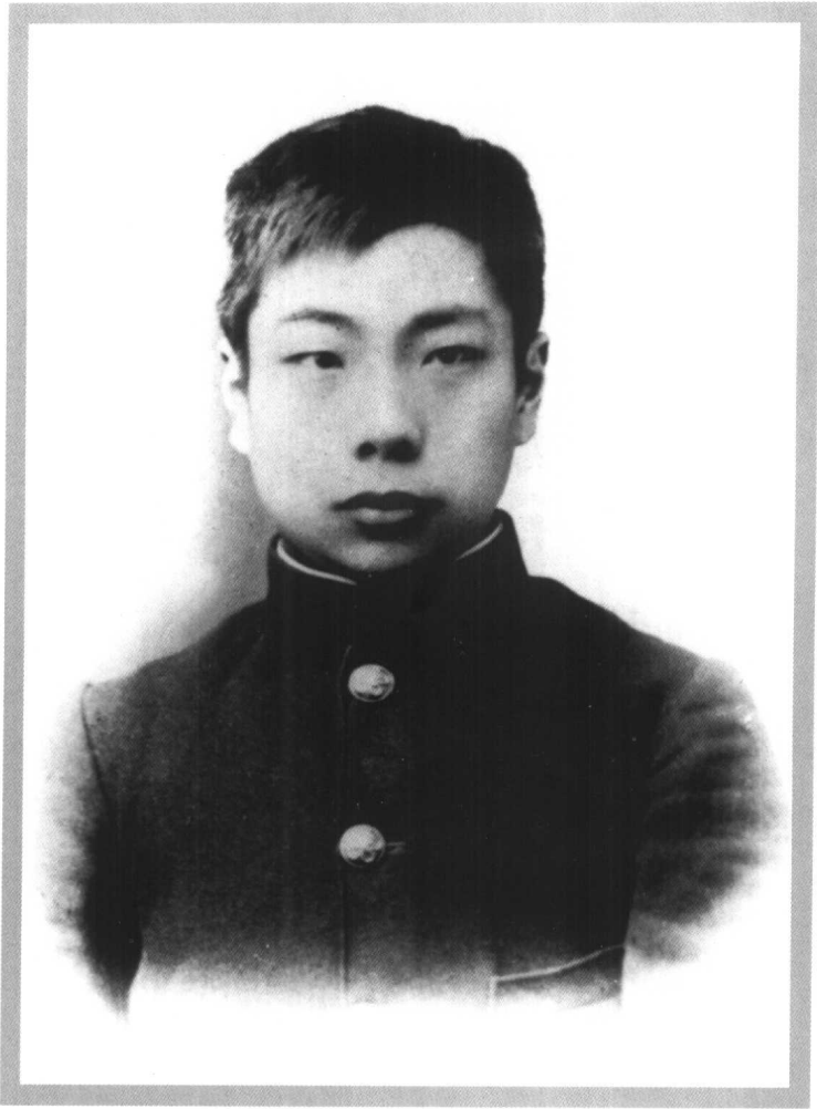
留学日本时摄于日本东京（一九〇三年）