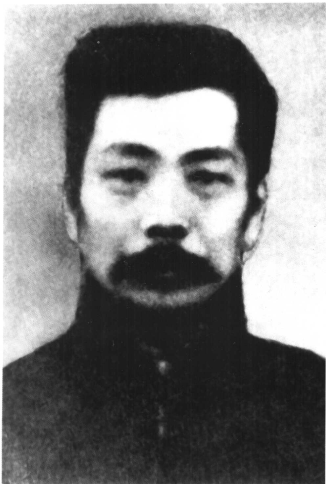
一九一八年一月十三日摄于北京大学二院