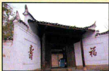
龙潭镇赵世炎故居