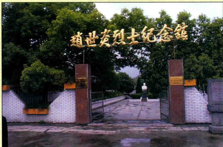
赵世炎烈士纪念馆