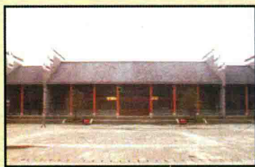
赵世炎烈士陈列馆