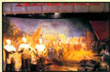
赵世炎和周恩来、罗亦农等领导的上海三次工人武装起义场景