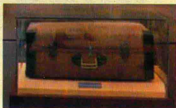
赵世炎赴法勤工俭学使用过的藤箱