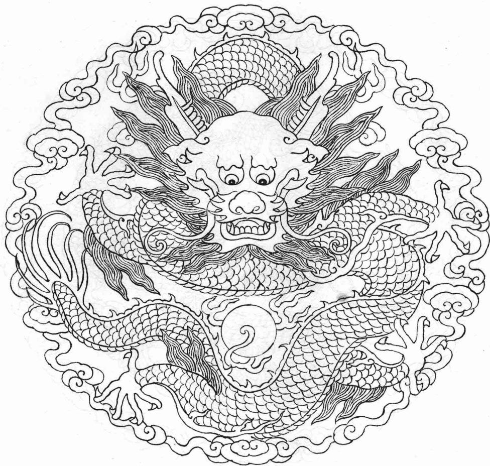
4 坐 龙