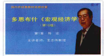
北京大学王志伟教授