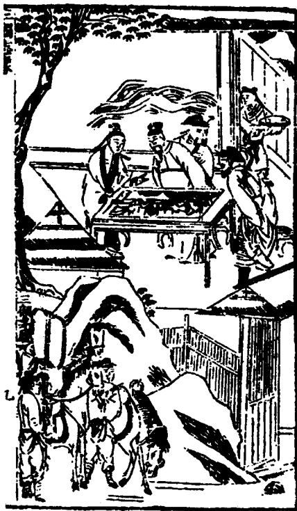
《三国演义》——三顾茅庐