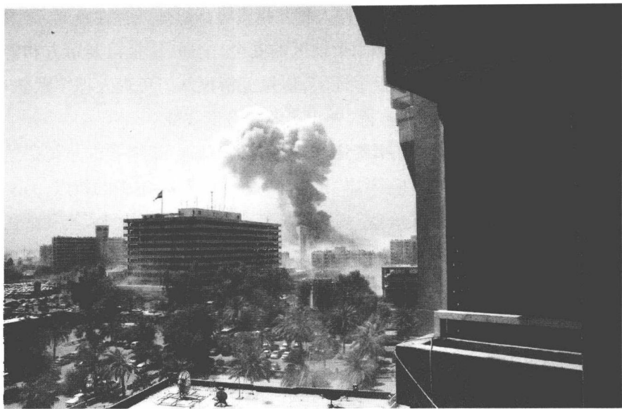
伊拉克外交部遭袭