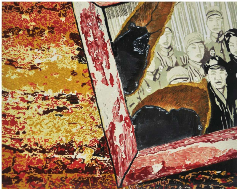
作品名称：《燃情岁月》 作者：孙佳兴