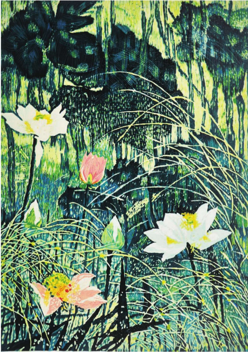
作品名称：《荷韵》 作者：徐敏