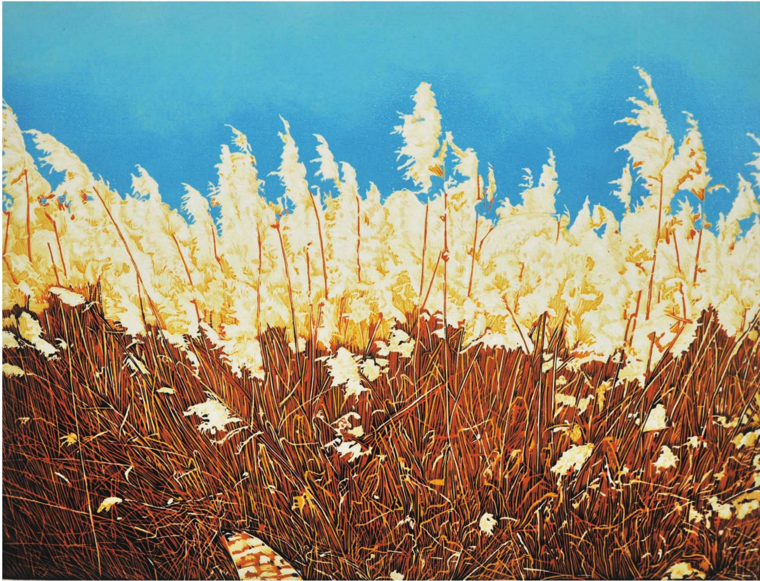
作品名称：《秋浓》 作者：李均