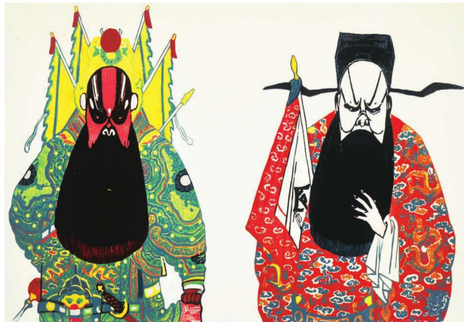
作品名称：《忠奸》 作者：郑强