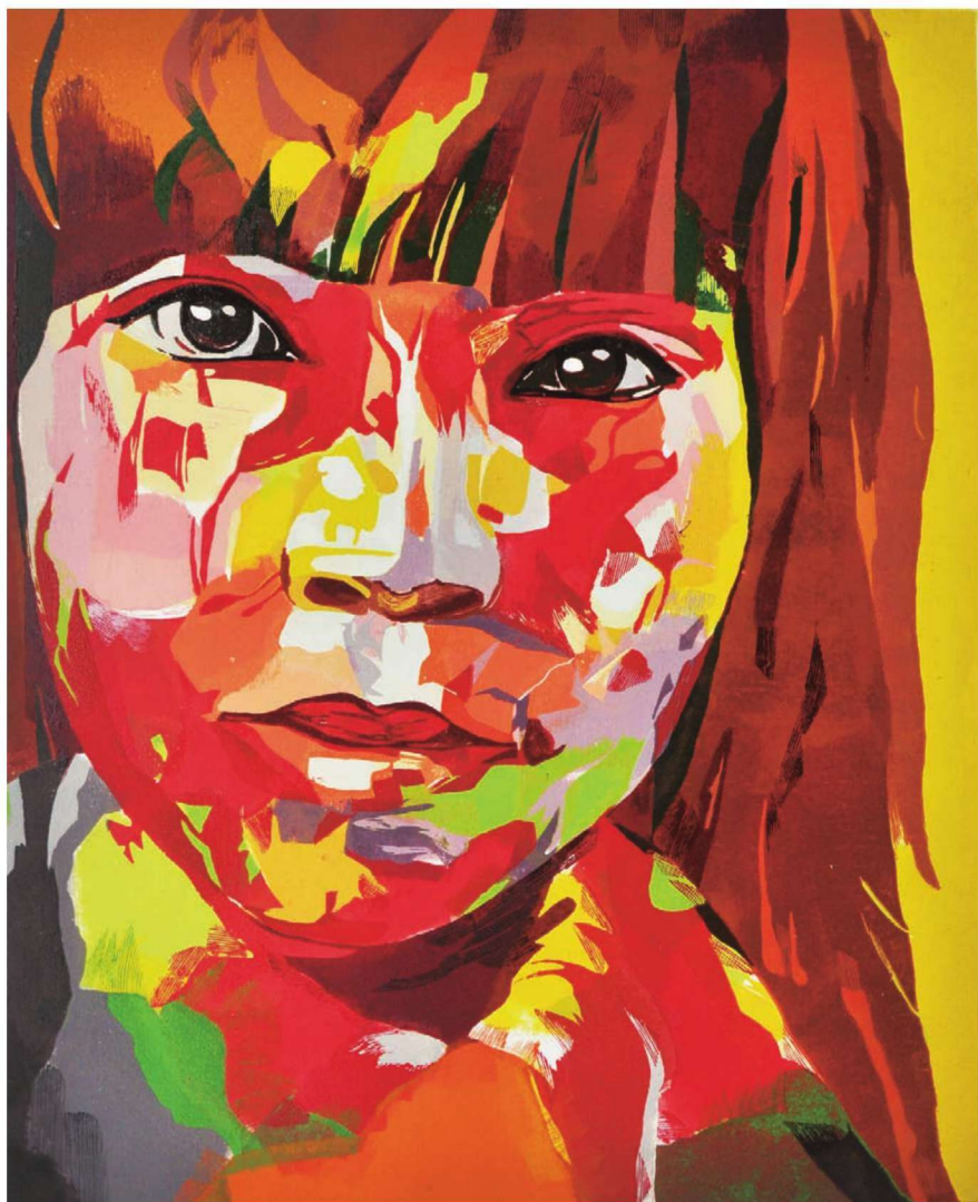
作品名称：《空白序》 作者：陈欢