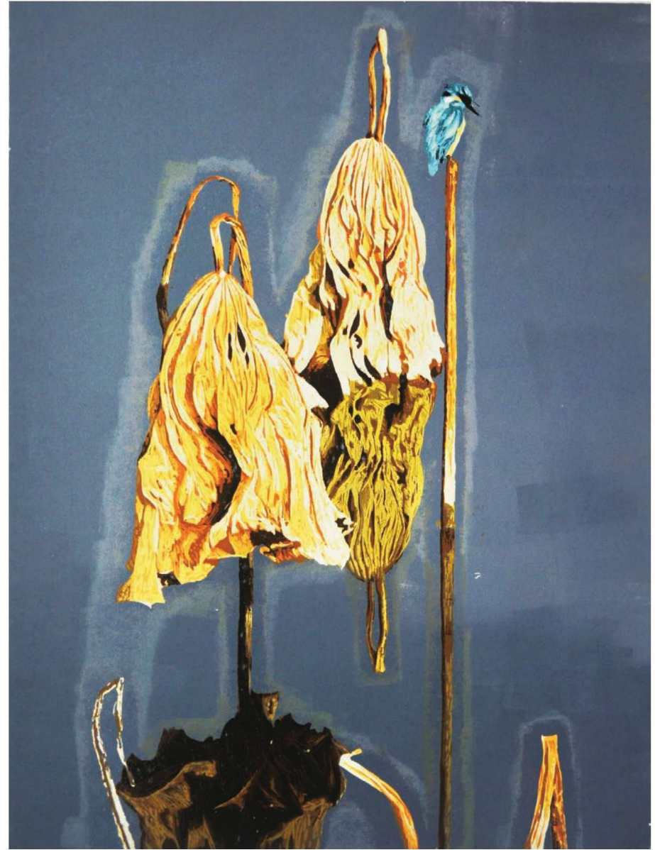
作品名称：《残荷峻毅》 作者：朱菁菁