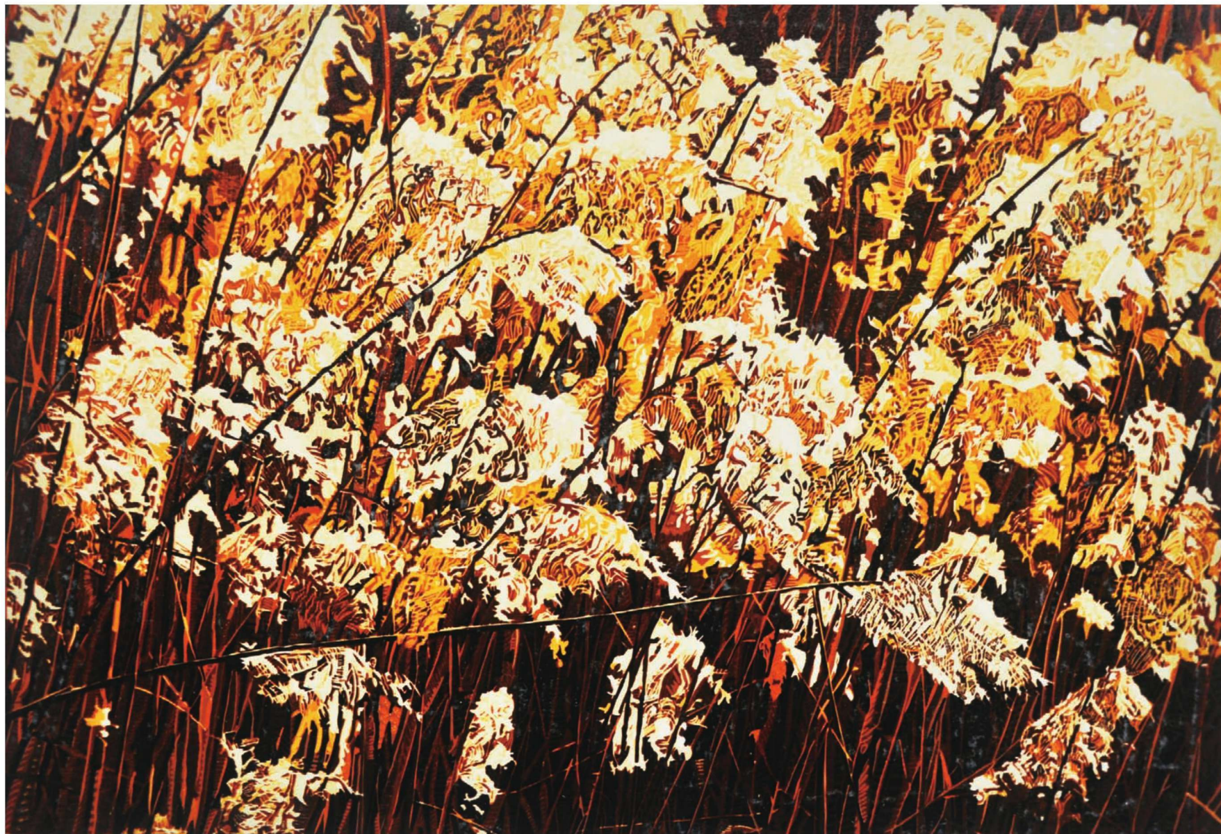
作品名称：《金秋时节》 作者：满洪英