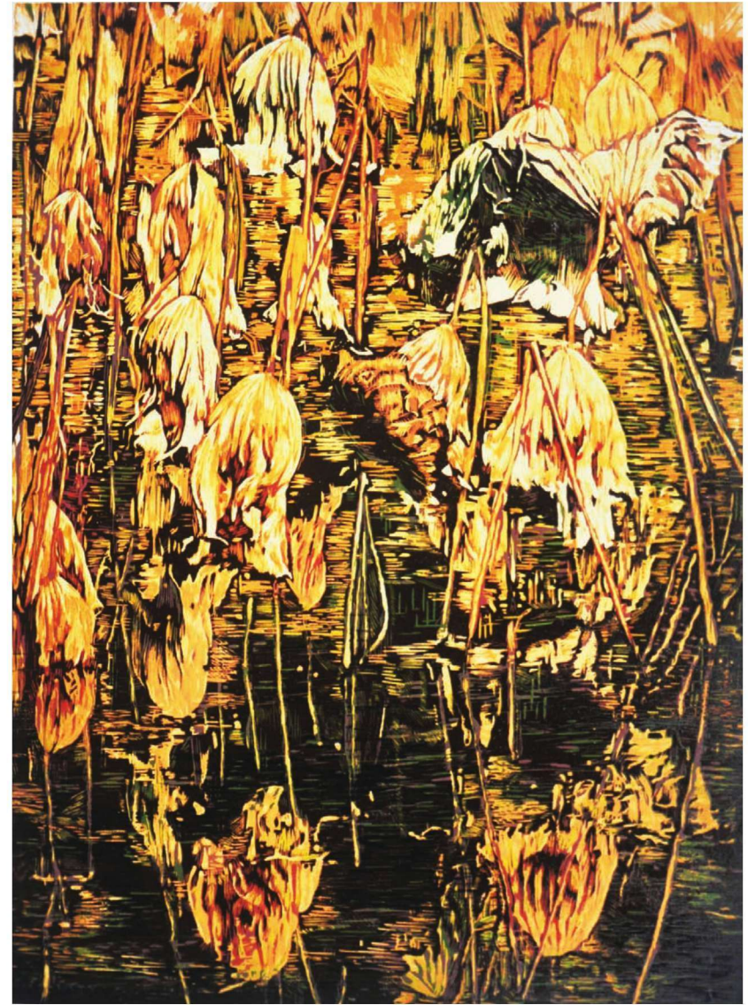
作品名称：《秋颂》 作者：唐泽单