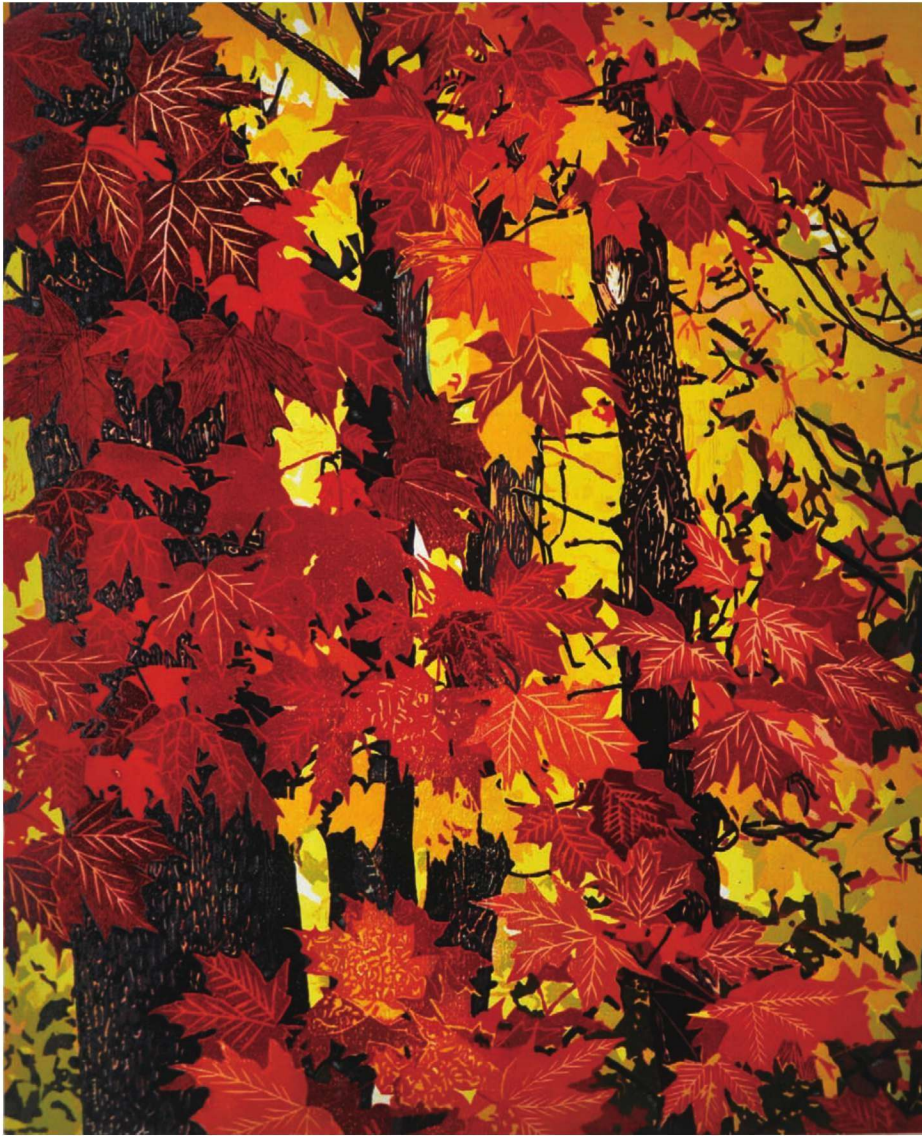
作品名称：《爱在深秋》 作者：吴琳