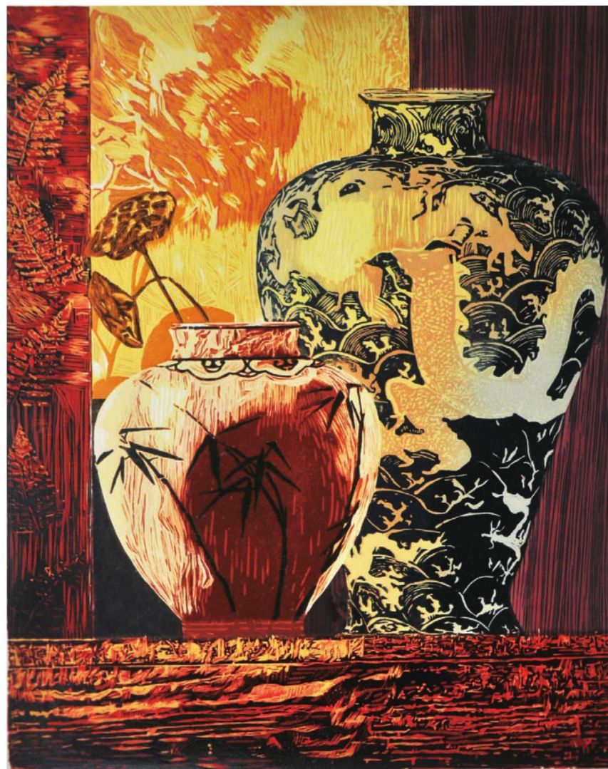
作品名称：《旧时光》 作者：程琳