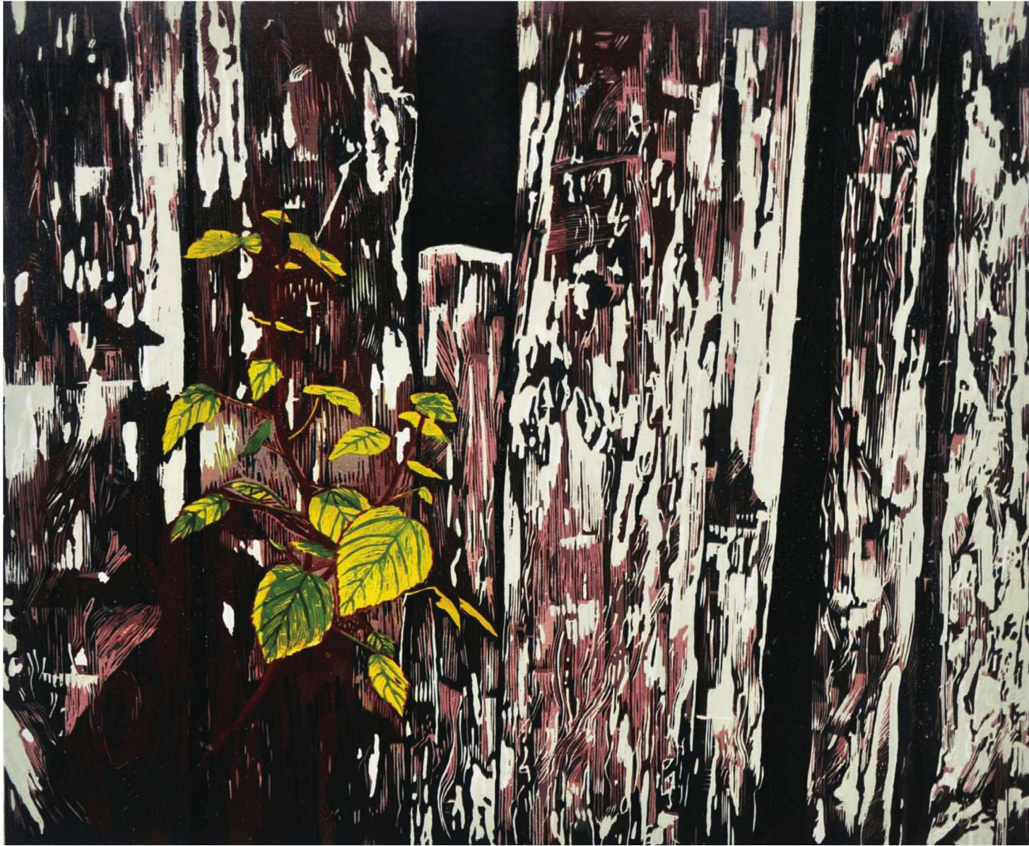
作品名称：《向往》 作者：张骏捷