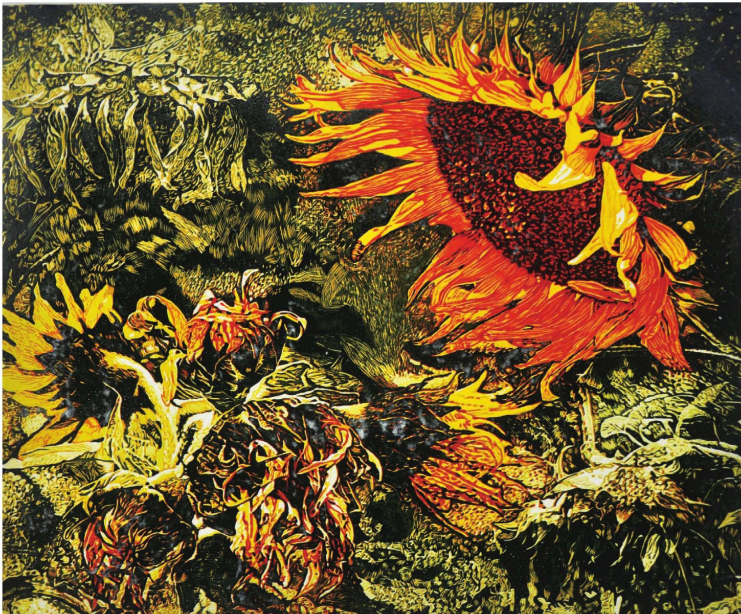
作品名称：《怒放的生命》 作者：彭思思