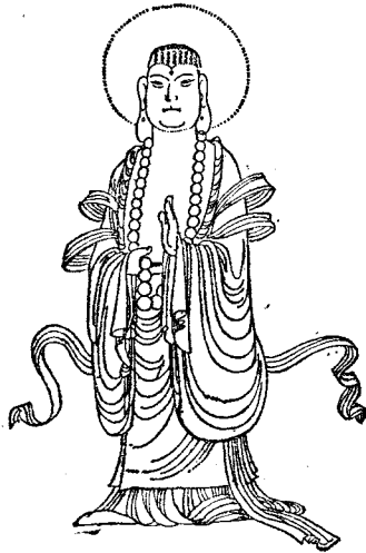
如 来 佛