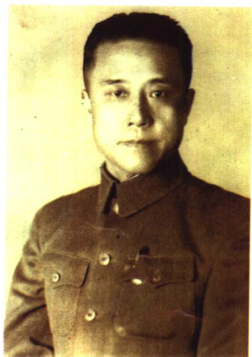
父亲虽然出身北大，但是他很平凡