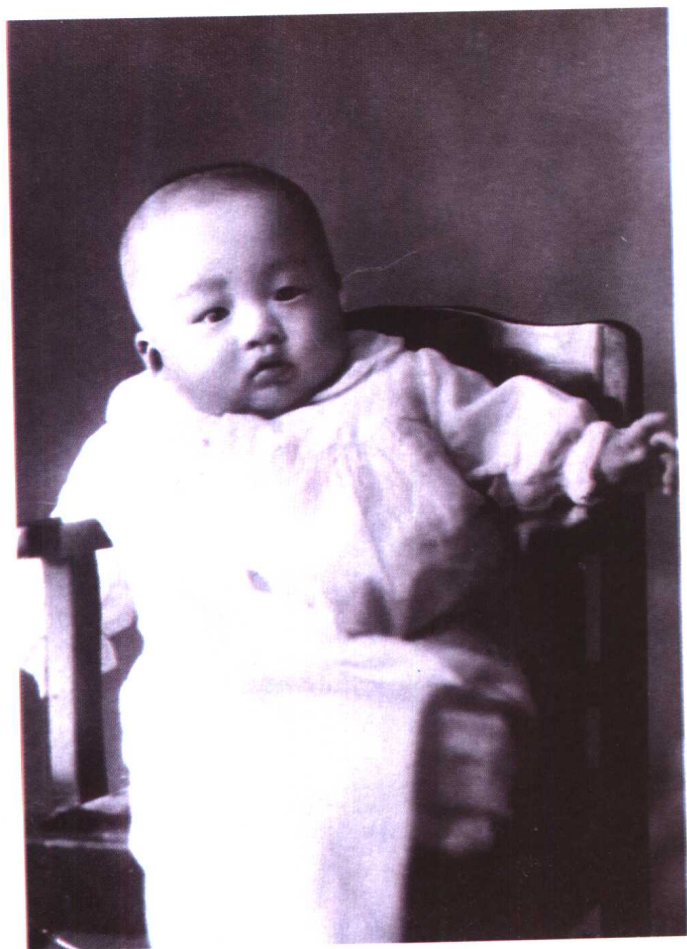
一九三五年的我，一岁