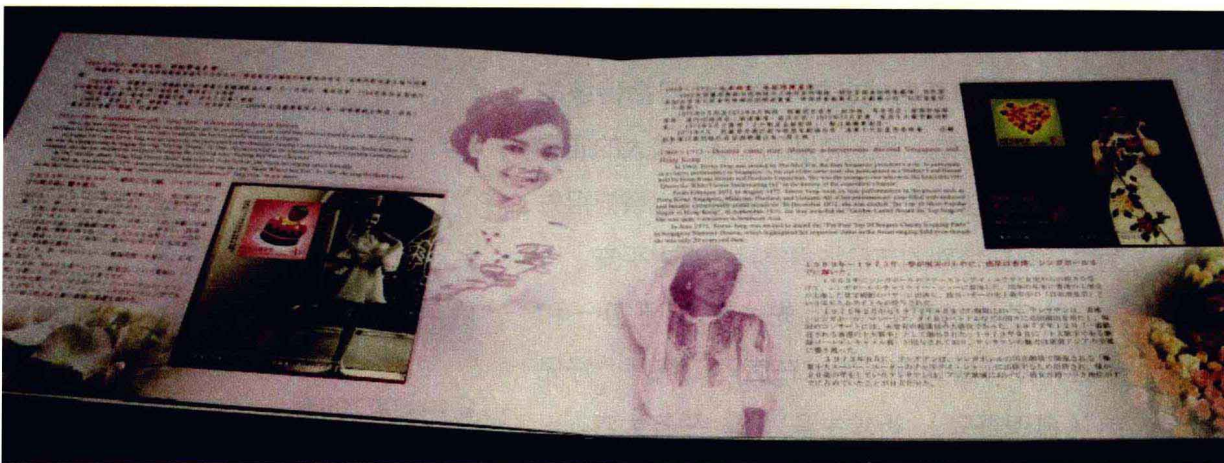
具有怀念意义的邓丽君集邮画册