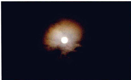
中秋赏月，最能显现出“月是故乡明”

从农历除夕到元宵的过年时节，以及清明、端午、中元到中秋的时令节庆，台湾保有完整的“过节”文化。除夕吃团圆饭、初二回娘家、元宵提灯笼、清明扫墓、端午吃粽子，以及中秋赏月吃月饼，显示出两岸节日庆典的相同之处。