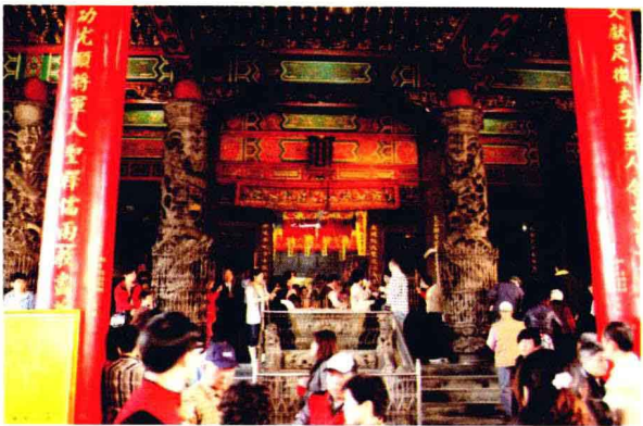
过节时分，寺庙中涌进满满的信徒

特定的寺庙也会定期举办活动，如每年九月二十八日为孔子诞辰，在台北和台南孔庙均会举办祭孔大典，并举行成年礼；供奉玉皇大帝的庙宇会在农历的大年初九举行“天公生”（玉皇大帝生日）的法会。