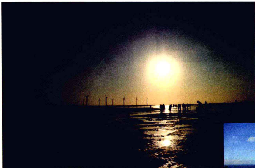
落日映照的金色世界

前往台湾旅游，体会悠闲的海洋风情是必备的行程之一。挑选合适的海边景点，并安排半日到一日的休闲之旅，让身心放松在蓝天碧海的土地上，享受悠闲的海岛风光。