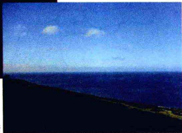
碧海蓝天的岛屿风情