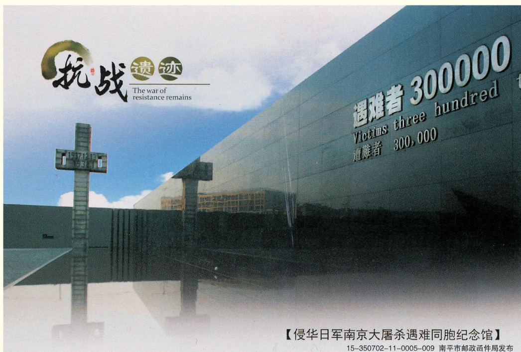
【侵华日军南京大屠杀遇难同胞纪念馆】

侵华日军南京大屠杀遇难同胞纪念馆（2015年4月中国南平市邮政局发行映日荷花普资加印片）