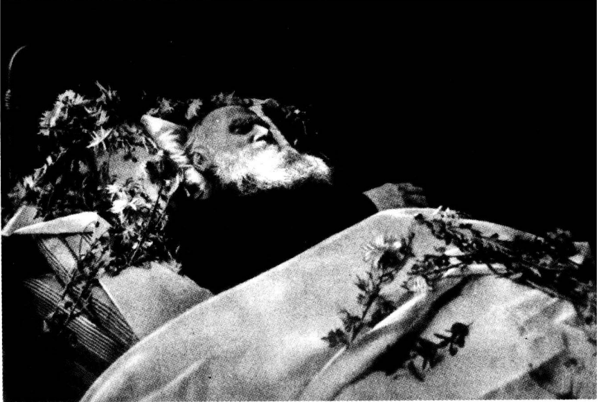
1910年，列夫·托尔斯泰最后的遗容