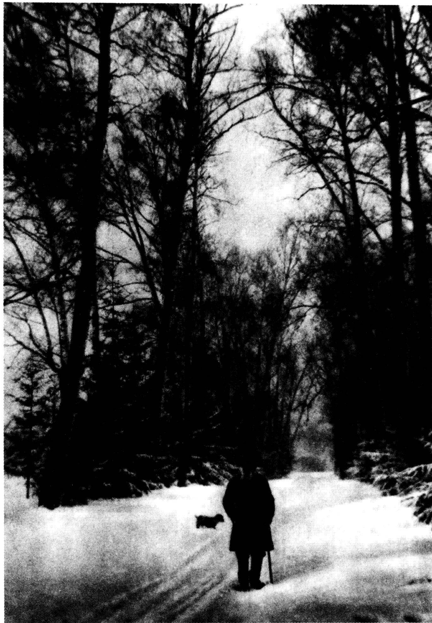
列夫·托尔斯泰，1909年摄于雅斯纳亚·波良纳