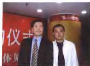
与GOOGLE中国区总裁李开复博士合影