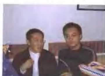
采访著名作家海岩