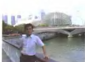
在新加坡参加国际会议