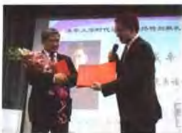
与著名经济学家郎咸平教授清华讲座