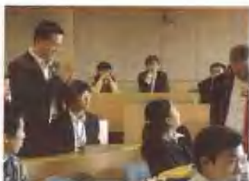
在韩国科学技术院(KAIST)访问