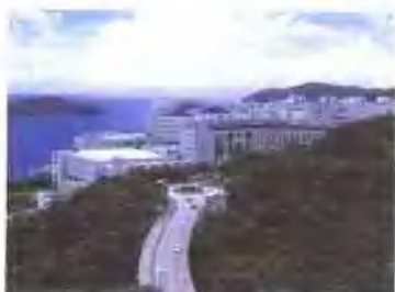
依山傍海的香港科技大学