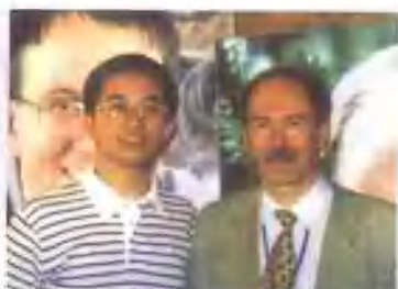
与诺贝尔物理学奖得主G. T. Hooft 博士合影