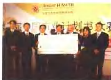
中国商业计划书大赛冠军团队