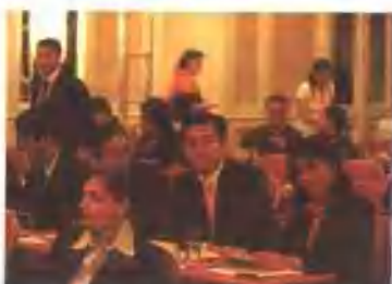
与创业伙伴在中国商业计划书大赛决赛现场