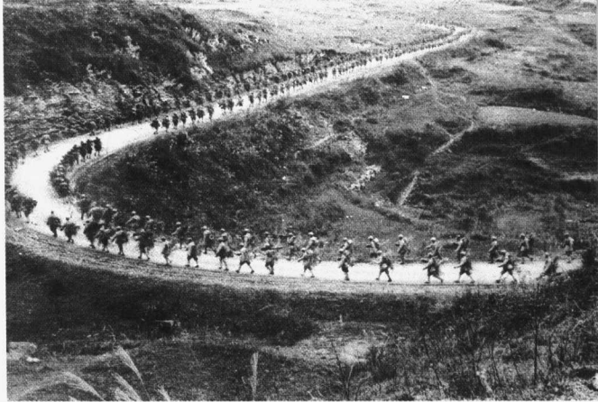
解放军向西南进军

海军、空军各一部,共150万余人,在地方武装和人民群众的支援配合下,在华东、中南、西南和西北股匪严重地区,展开大规模的剿匪斗争。全国新解放区历时4年的清剿匪特的斗争,共歼灭匪特268万余人。剿匪斗争的胜利,安定了社会秩序,巩固了新生的人民政权,为国家顺利地进行社会主义革命和建设打下了坚实的基础。