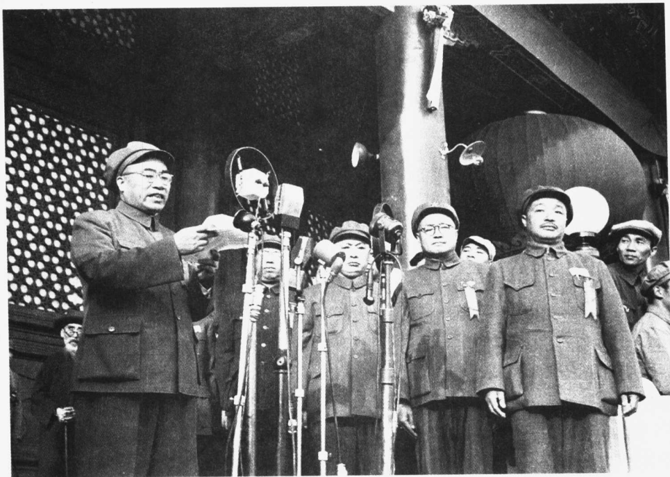
开国大典上，朱德宣读中国人民解放军总部命令

独立国家的承认和支持。但是，以美国为首的西方势力，拒绝承认中华人民共和国，推行在外交上孤立、在经济上封锁、在军事上包围中国的政策，继续支持和援助国民党残余势力进行顽抗、破坏和捣乱，阻挠中国人民解放台湾，企图把新中国扼杀在摇篮里。在国内，