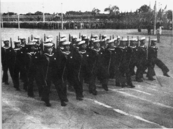
解放军陆、海、空部队通过天安门城楼，接受党和国家领导人的检阅

国民党反动派还有一百多万军队盘踞在西南和中南、西北、华东部分地区及东南沿海部分岛屿，包括广东、广西、四川、贵州、云南、西康（辖今四川省