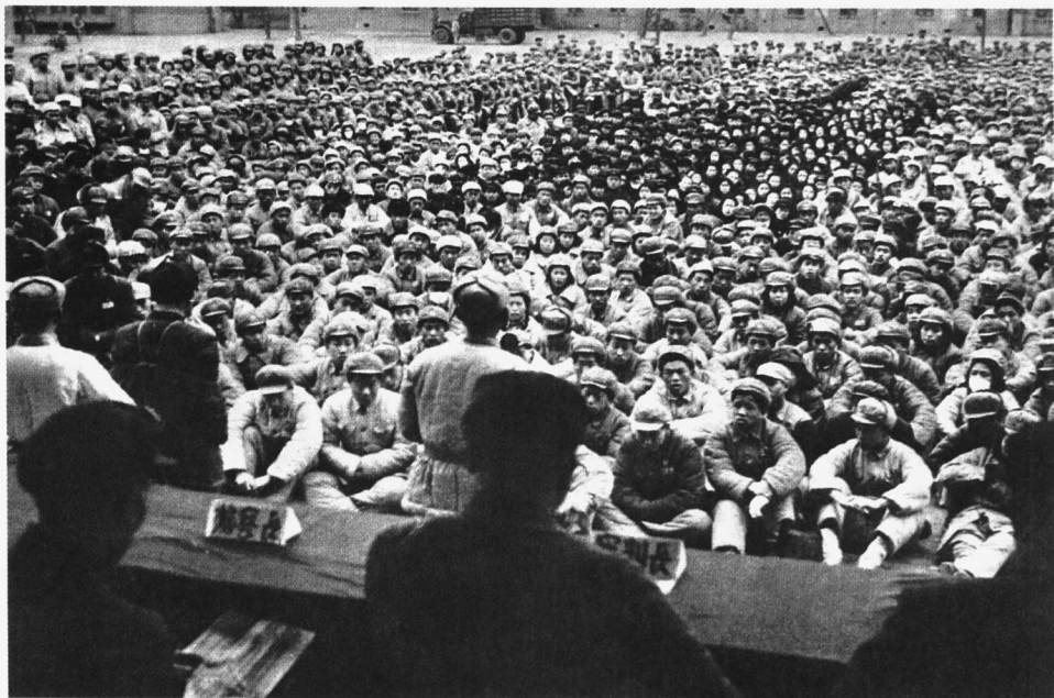
解放军某部召开审判反革命分子大会

委正式赋予了第3野战军进行攻台作战准备的任务，由第3野战军副司令员粟裕负责，开始制订台湾战役计划，进行解放台湾的各项准备。