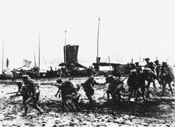
解放军第3野战军第7兵团解放舟山群岛

西部和西藏自治区东部，1955年撤销）、西藏的全部，甘肃、湖南、湖北、福建各一部，台湾、海南岛和沿海岛屿，仍在国民党反动派的控制之下。新解放区的基层政权尚未健全，国民党军队溃逃时留下的残余力量以及潜伏的特务和反革命分子，同土匪和各种反动势力相勾结，进行各种破坏活动。由于长期遭受帝国主义列强的侵略和掠夺，由于遭受长期战争的破坏，整个国民经济处于全面崩溃的状态，通货膨胀恶性膨胀，大批工厂停产，大量工人失业，农业连年歉收，灾民流离失所，这些问题严重威胁着新生政权的巩固。在这种形势下，人民解放军担负着将解放战争进行到底，巩固和保卫新生国家政权的重大任务。