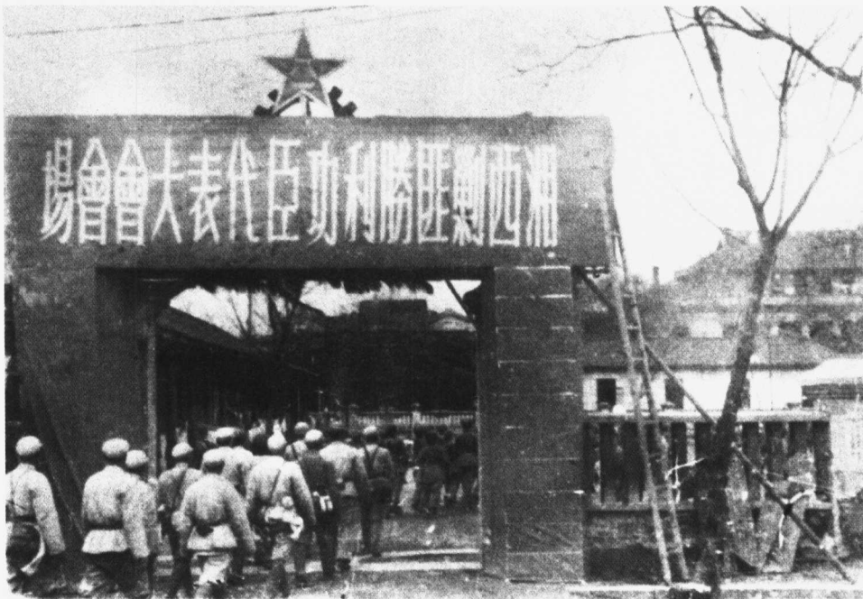
解放军湘西剿匪部队召开剿匪功臣代表大会