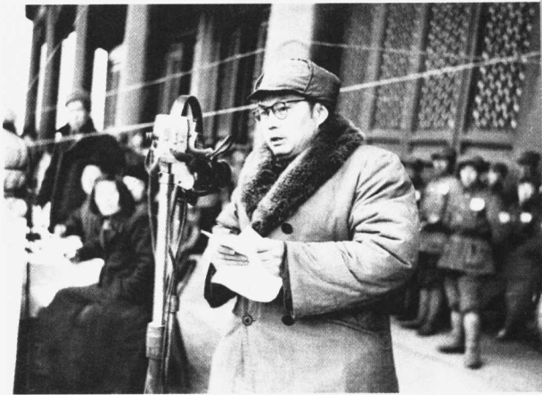
北平(北京)军事管制委员会主任叶剑英在庆祝北平解放大会上讲话

全国解放战争后期,随着大中城市的陆续解放,1948年11月15日,中共中央根据各地新解放城市的管理经验,发出《关于军事管制问题的指示》,指出“实施军事管制的办法,甚为有效”,要求新解放的城市一律成立由