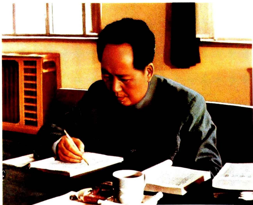
一九六〇年，毛泽东同志在校订《毛泽东选集》第四卷。