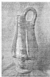
平泉出土的辽代各式鸡冠壶