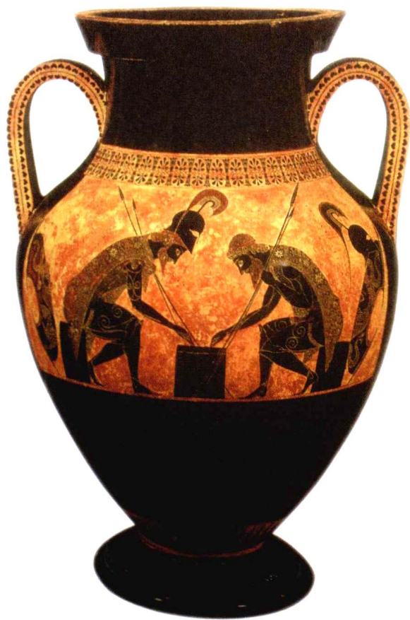
图2-2 《阿喀琉斯和埃阿斯对弈》黑绘式陶瓶 约公元前540年

黑绘式陶瓶《阿喀琉斯和埃阿斯对弈》以白线刻描，刮出细长的轮廓，线条风格刚硬直转。此类的黑绘风格陶瓶，就是在白底上用线条勾画形象，并涂上黑色。而这个时期的瓶画人物，则多以剪影的形式出现