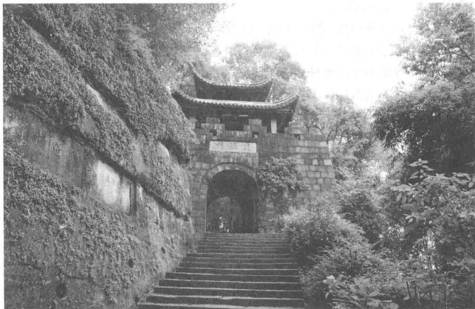
图为钓鱼城护国门

蒙哥汗八年（1258），蒙哥大汗统兵 4 万，号称 10 万，分兵三路进攻四川，十二月，攻陷了川西北 54 个州、府，进抵武胜山（今武胜县城附近），准备攻合州。派南宋降将晋国宝入钓鱼城招降，结果晋国宝被王坚斩杀。蒙哥汗九年（1259）正月，蒙哥汗仗着兵强马壮，不听军师不纳术速忽里避开坚城，迂回夔、万东下的建议，决定强攻钓鱼城。蒙哥汗派诸王末哥攻礼义山城（今渠江东北三教寺寨），曳刺秃鲁雄攻平梁山城（今四川巴中西），命宋降将杨大渊突袭合州旧城，切断外围与钓鱼城的联系，同时令四川都元帅纽璘在涪州蔺市（今涪陵西）造浮桥断绝宋援，在铜罗峡据险筑垒，切断重庆宋军北进之路，对钓鱼城形成铁壁合围之势。二月二日，蒙哥汗率军渡过鸡爪滩（今钓鱼城东北鸡心石），驻于城东石子山上，三日，蒙哥亲督诸军攻钓鱼城。七日攻一字城墙，九日攻镇西门，都没有攻下来。接着，蒙古东道军史天泽也率部前来参加了钓鱼城之战。三月，进攻东新门、奇胜门、镇西门、小堡，均遭失败。四月二十二日是连降了 20 天大雨后的一个初晴日，蒙军偷袭护国门没有得逞，第二天攻破城