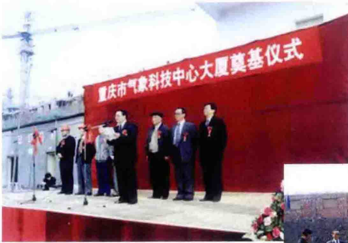
2000年，重庆市气象局气象科技大楼在新牌坊奠基