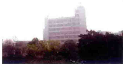
1988年1月，重庆市气象局 “713”雷达业务楼竣工使用