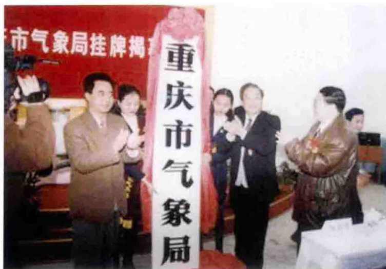
1997年，重庆直辖市 气象局授牌仪式