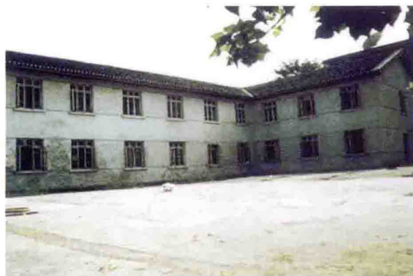
1969~1986年，重庆市气象局业务办公楼和积雪状况时的观测场（陈家坪）