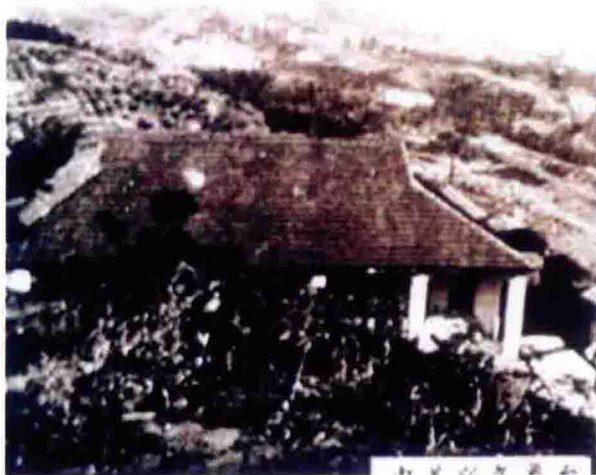
1944年，“中美合作所”在钟家山设立气象台