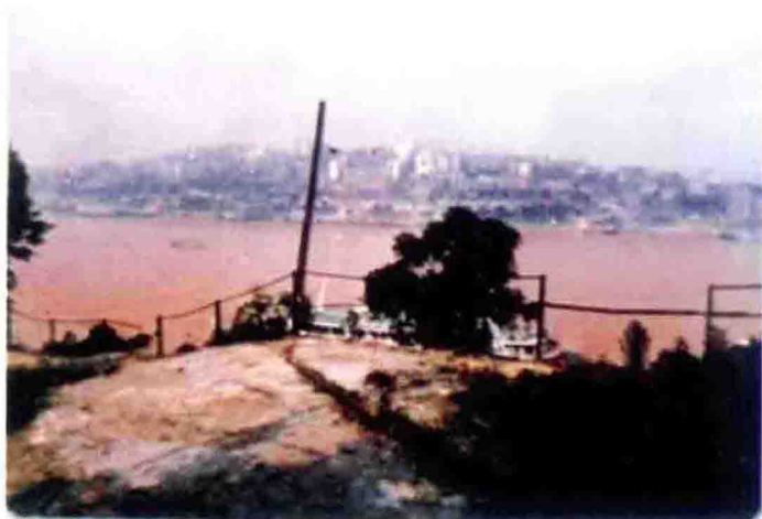
清光绪十七年（1891年），重庆海关在南岸玄坛庙设立测候所