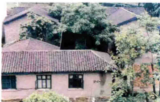
1941年，国民政府在重庆沙坪坝高家花园6号（现饮水村104号沙坪坝区气象局院内）正式成立中央气象局