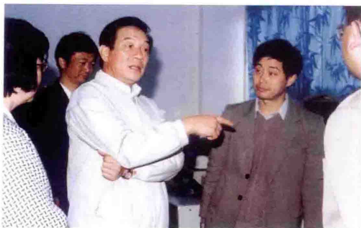
1989年，世界气象组织主席、中国气象局局长邹竟蒙(中)在市气象局视察