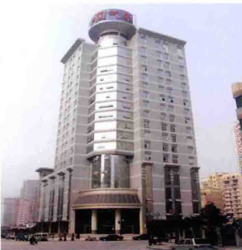
2004年，重庆市气象局科技大楼启用，市气象局机关从陈家坪迁入新楼办公