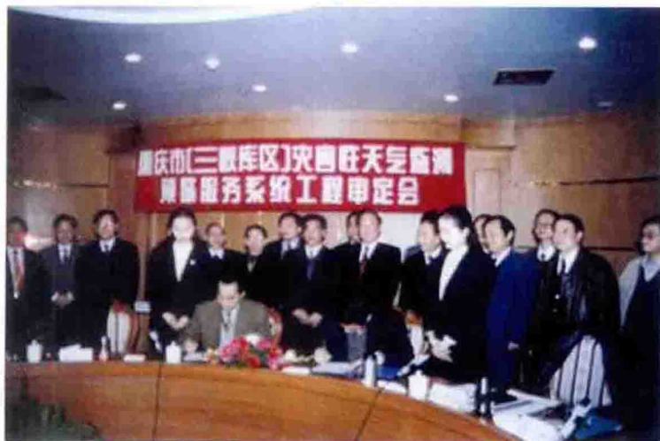
1998年，重庆市（三 峡库区）灾害性天气监测 预警服务系统工程审定会