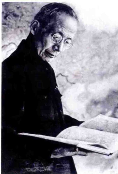
抗战时期，著名气象学家竺可桢在重庆工作，并积极筹备成立了国民政府中央气象局