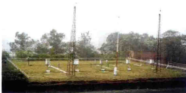
1986年，重庆市气象局计划单列，同年地面观测业务从陈家坪迁移合并到沙坪坝区气象局