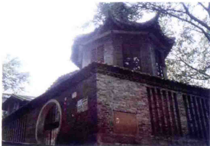
1935年，江北县建设局在江北嘴建立测候所