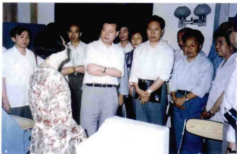
1993年，四川省副省长张中伟（左四）到市气象局视察