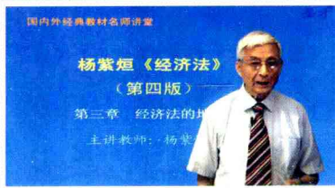
▲北京大学杨紫焜教授